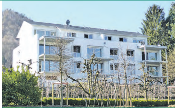
Der Neubau in Bodman verfügt über eine Gesamtwohnfläche von etwa 1.150 Quadratmetern.

Fläche: Das neu erstellte Wohngebäude verfügt über eine Gesamtwohnfläche von etwa 1.150 Quadratmetern. Die einzelnen Apartments haben Flächen von 75 bis 150 Quadratmetern. Zwei der neun Wohnungen haben dabei 75 Quadratmeter, eine verfügt über 107 Quadratmeter, und die restlichen haben eine Größe von 150 Quadratmetern.