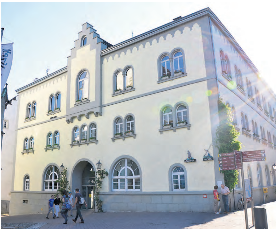
Radolfzell hat die Wahl: Am Sonntag, 25. Mai, wird im Zuge der Kommunalwahl der neue Gemeinderat in Radolfzell gewählt. Insgesamt treten in Radolfzell mit der CDU, der FDP, der Freien Grünen Liste, den Freien Wählern und der SPD fünf Fraktionen zur Wahl an. Wer den Sprung in das Radolfzeller Rathaus schafft, steht derzeit allerdings noch in den Sternen.

SPD: Die Seetorquerung in der sogenannten Vorzugsvariante hat, wenn die Berechnungen durch die Gutachten bestätigt werden, für die SPD die höchste Priorität. Dies schließt auch die Weiterentwicklung der Flächen entlang der Karl-Wolf-Straße ein, genauso wie die Überplanung der stadseitigen Flächen von der Paketposthalle bis zur Mooser Brücke. Weitere Projekte sind: Libellenwegunterführung, Ausbau, Weiterentwicklung (Gemeinschaftsschule) und Sanierung der Schulen,