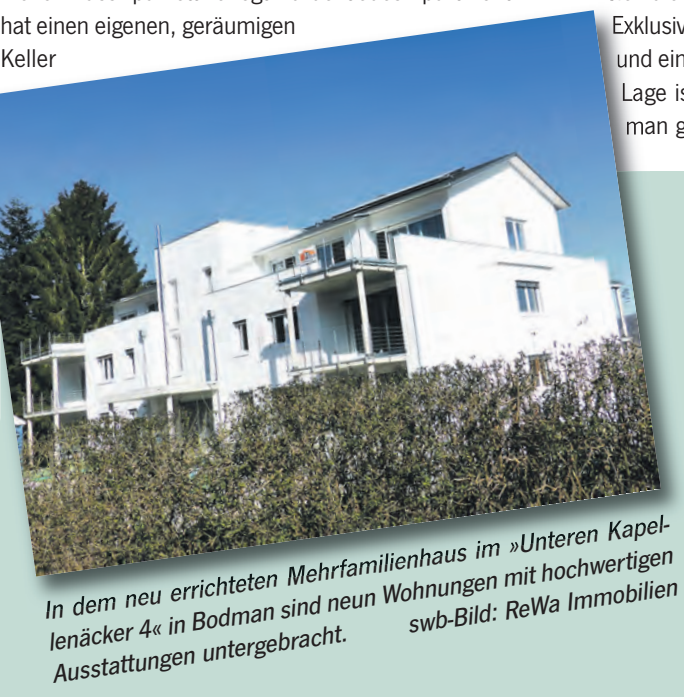
In dem neu errichteten Mehrfamilienhaus im »Unteren Kapellenäcker 4« in Bodman sind neun Wohnungen mit hochwertigen Ausstattungen untergebracht.

Die Nähe zum Bodensee, die wenigen Minuten bis zur Ortsmitte, die ruhige Umgebung und die Lage des Mehrfamilienhauses im »Unteren Kapellenäcker 4« sprechen für das Objekt. Ebenso wurde das zweigeschossige Gebäude mit Dachterasse nach den neuesten ökologischen Standards und Umweltrichtlinien errichtet. Der Neubau verfügt über eine Solaranlage auf dem Dach zur Unterstützung der Heizung. Die Befuerung erfolgt über eine Gas-Brennwertanlage. Die Kunststofffenster sind weiß und dreifach isoliert verglast, so dass sich die Energiekosten in Grenzen halten werden. Exklusives Wohnen mit einer grandiosen Aussicht und einer hochwertigen Ausstattung in optimaler Lage ist im »Unteren Kapellenäcker 4« in Bodman gegeben.