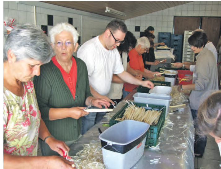
Die Vorbereitungen für das Spargelfest in Bankholzen beginnen bereits am kommenden Samstag. Über 100 Kilogramm des köstlichen Höri-Spargels werden dann für das Spargelfest am Sonntag, 18. Mai, geschält.

garten in Bankholzen leckere Spargelgerichte in verschiedenen Variationen angeboten. Als Vorspeise empfiehlt sich eine cremige Spargelsuppe und danach entweder ein leichter Spargelsalat oder – für den größeren Hunger – ein Spargelteller mit Schinken, Kräuterwaffeln und Sauce Hollandaise. Und da Spargel ohne den dazu passenden Wein nur ein halbes Vergnügen wäre, gibt es tolle lokale Weine aus Bohlinger und Gaienhofer Lagen vom Weingut Rebholz.