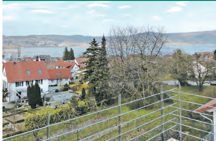
Die Aussicht ist grandios: Jede Wohnung des Neubaus im »Unteren Kapellenäcker 4« in Bodman kann mit einem Seeblick aufwarten.