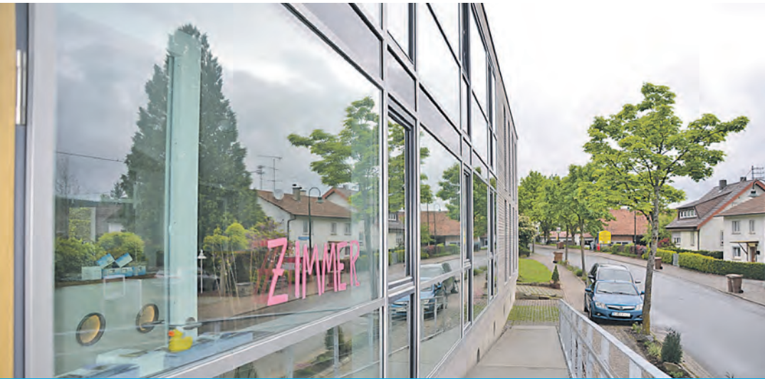
Edel, einladend, freundlich - das Hotel »Anker« in Bodman.