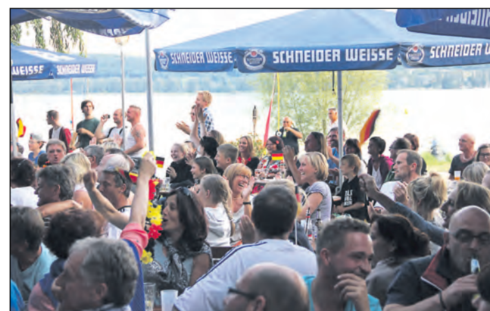
Das war ein Auftakt nach Maß: Die deutsche Nationalmannschaft ließ den Portugiesen bei ihrem ersten Auftritt nicht den Hauch einer Chance und fegte die Elf um Weltfußballer Cristiano Ronaldo mit 4:0 vom Platz. Danach kannte der Jubel in und um Radolfzell keine Grenzen. Zahlreiche Fußballfans verfolgten das WM-Spiel beim Public Viewing. Egal ob im Milchwerk oder wie hier am Radolfzeller Seeufer – zahlreiche Fußballfans nutzen die Gunst der Stunde, um mit Gleichgesinnten gemeinsam zu feiern.

Mutter etwa wegen Krankheit oder eines Kuraufenthalts länger ausfällt. »Im Landkreis Konstanz gibt es zur Entlastung der Eltern auch das Ehrenamtsprojekt »welcome«, welches