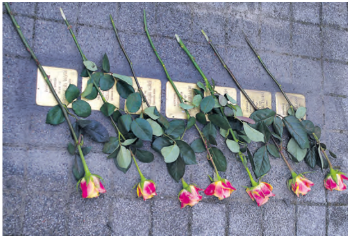
Wider das Vergessen: Am Samstag, 28. Juni, werden in Radolfzell die ersten acht Stolpersteine verlegt.