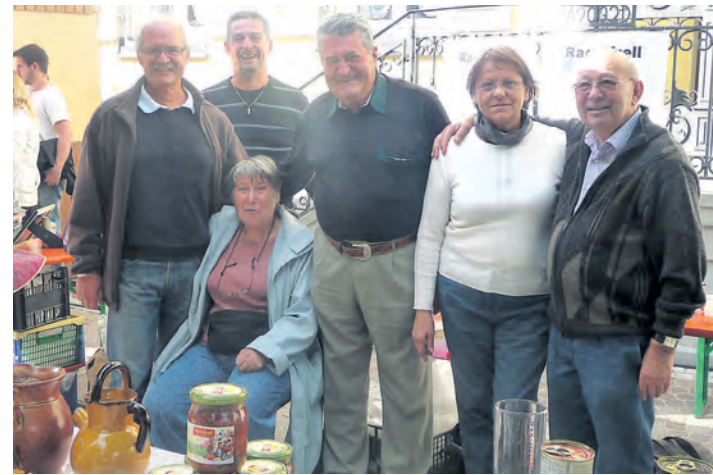
Istrianer zu Gast in Radolfzell: Seit Jahren besteht die Städtepartnerschaft zwischen Radolfzell und Istres. Jährlich statten die Franzosen dem Bodensee einen Besuch ab. In diesem Jahr feiert die Freundschaft ihr 40-jähriges Jubiläum.

Radolfzell (gü). Die Franzosen kommen: 2014 soll im Rahmen des Hausherrenfests die Verbindung zwischen Radolfzell und der französischen Stadt Istres erneut besiegelt werden. Im Rahmen der Jubiläumsfeierlichkeiten werden vom 18. bis zum 22. Juli rund 150 Istrianer in Radolfzell erwartet, um gemeinsam die 40 Jahre währende Städtepartnerschaft zu feiern. Der Gemeinderat hat für die Feierlichkeiten ein Budget von 55.000 Euro genehmigt. Um bestens auf das Jubiläum vorbereitet zu sein, entschied sich das mit den Feierlichkeiten beauftragte Jumelage-Komitee dazu, seine Sitzungen öffentlich abzuhalten. Wie viel Arbeit hinter den Planungen steckt, verdeutlicht ein Blick in den Veranstaltungskalender des Jubiläums: Allein neun Aktionen sind öffentlich und laden zum gemeinsamen Feiern mit den Freunden aus