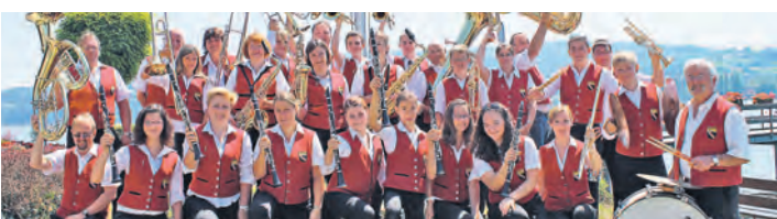
Die Bürgerkapelle Hemmenhofen spielt vom 27. Juni bis zum 15. August immer freitags zur Promenadenkonzertsaison.

auftreten. Unter ihnen sind der MV Bohlingen am 4. Juli, MV Liggeringen am 18. Juli, das Mühlbach-Quintett am 1. August und die Seniorekapelle des MV Böhringen am 8. August. Selbstverständlich ist für Speis und Trank bestens gesorgt. Die Konzerte finden jeweils freitags ab 19.30 Uhr in den Uferanlagen von Hemmenhofen statt.