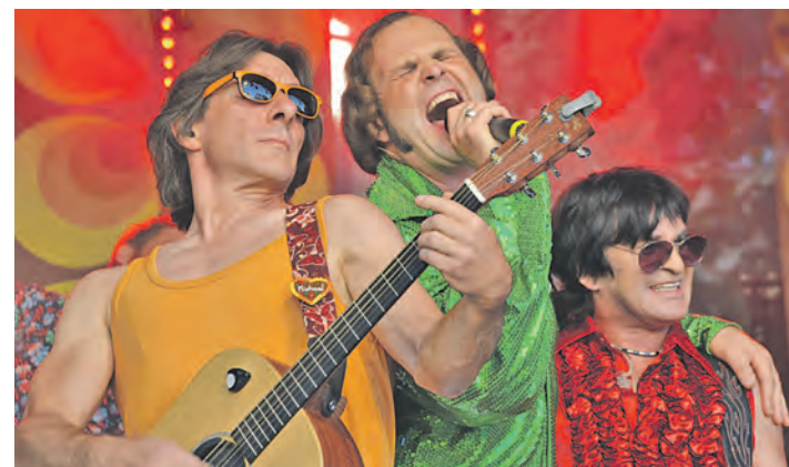
Heizten wieder mit »Albany«, »Lucille« oder »Mendocino« ein - »Papi's Pumpels«.

Mehr Fotos dazu stehen unter bilder.wochenblatt.net .