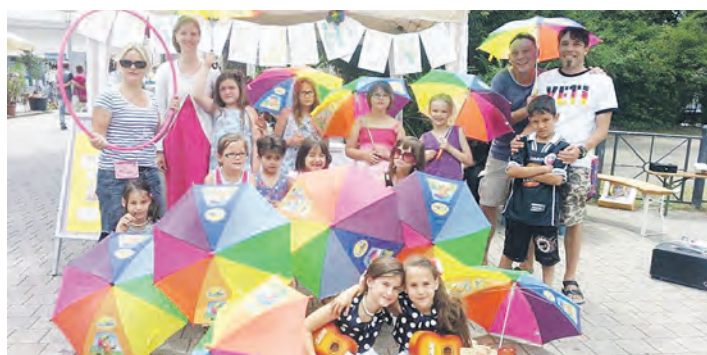
Ein kunterbuntes Kinderfest veranstaltet die Kinderwohnung der Diakonie jüngst in Radolfzell.

Treffpunkt ist im Hermann-Hesse-Haus in Gaienhofen. Interessierte können sich jederzeit unter www.hermann-hesse-haus.de oder unter 07735/440653 zu der Kräuterkundung anmelden.