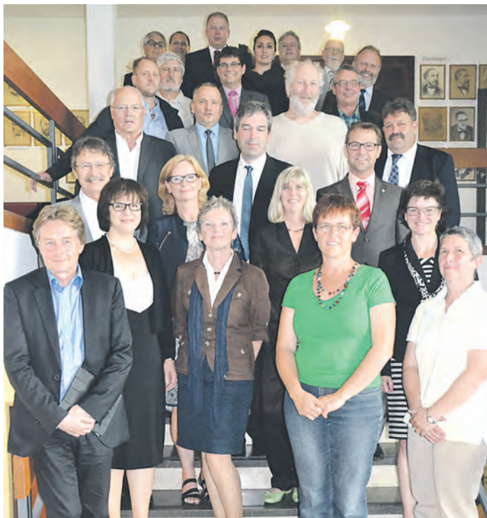
Am gestrigen Dienstag hat sich der neue Radolfzeller Stadtrat in seiner jüngsten Sitzung konstituiert.