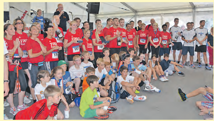
Siegerehrung beim ersten Stadtwerke Radolfzell Firmenlauf.