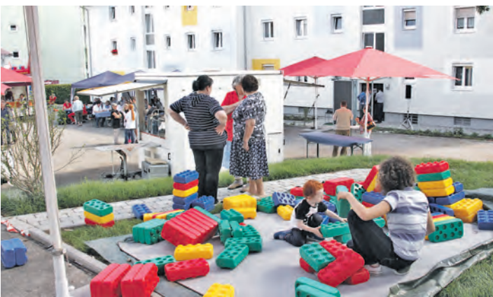
Groß und Klein feierten groß in der Conradin-Kreutzer-Straße.

Die Eingangüberdachung hat durch eine Konstruktion aus Stahl und Glas mit integrierter Briefkastenanlage ein freundliches Gesicht erhalten, und ein neuer Fassadenanstrich mit einer frischen Farbkombination sorgt für eine moderne Optik. Auch auf Umweltverträglichkeit wurde geachtet: Ein Vollwärmeschutz für die Fassade mit Dämmung von Keller- und Geschossdecke sorgt für eine gute Energieeffizienz des Gebäudes, und eine neue Holzheizung ist in Betrieb. Die Baugenossenschaft beheizt nach eigenen Angaben 62 Prozent ihrer Mietwohnungen mit dem heimischen Brennstoff Holz. Photovoltaikanlagen auf dem Dach wandeln Sonnenenergie in Strom um.