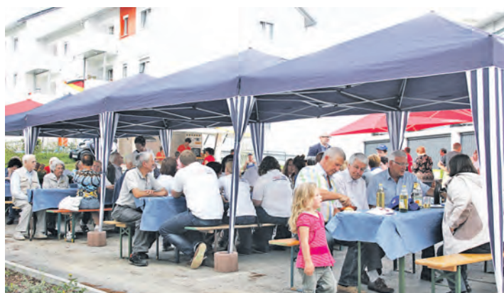
Die Baugenossenschaft Hegau modernisierte 36 Mietwohnungen in der Conradin-Kreutzer-Straße und feierte den Abschluss der Bauarbeiten mit einem großen Fest.

Etwa zwei Millionen Euro hat die Baugenossenschaft in die Arbeiten nach eigenen Angaben investiert: »Das sind mehr als 50.000 Euro pro Wohnung«. Laut einer Pressemitteilung wurde besonderer Wert auf Seniorenfreundlichkeit gelegt. So wurde eine Duschbadwanne mit Tür, die einen mühelosen Einstieg garantiert, im Zuge der Neugestaltung in alle Bäder eingebaut. Im Bad entstanden Waschmaschinenanschlüsse,