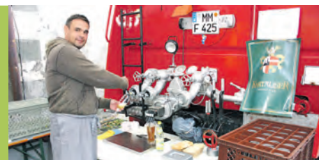
MI., 3. SEPTEMBER 2014

BUNTES PROGRAMM AM 6. SEPTEMBER VON 9.00 BIS 22.00 UHR