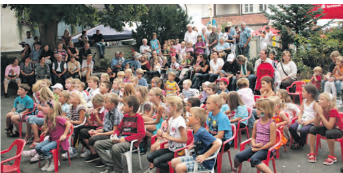
Das Öhninger Dorffest am 6. und 7. September ist ein Fest für die ganze Familie.