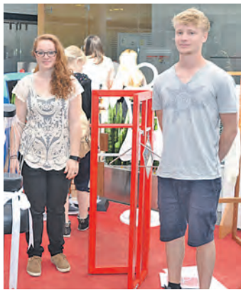
Die erfolgreichen Absolventen des zweijährigen Berufskollegs für Produktdesign am BSZ präsentierten jüngst ihre Abschlussarbeiten in der Sparkasse in Radolfzell.

Radolfzell (gü). »Stumme Diener« im Schalterraum: In der Zweigstelle der Sparkasse Singen-Radolfzell in der Hörstraße präsentierten jüngst die erfolgreichen Absolventen des zweijährigen Berufskollegs für Produktdesign am Berufsschulzentrum Radolfzell ihre Abschlussarbeiten. Und dass die jungen Nachwuchs-Designer, die sich nach bestandener Prüfung staatlich geprüfte Assistenten für Produktdesign nennen dürfen und ihre Fachhochschulreife in der Tasche haben, kreative Köpfe sind, bewiesen sie eindrucksvoll in ihren Werkstücken: Neben der praktischen Funktion, einem Platz für Hose, Hemd, Bluse, Krawatte und Co. mussten die Arbeiten ästhetisch wirkungsvoll sein, Originalität besitzen und aus mindestens 80 Prozent Holzanteile bestehen. Angeleitet wurden die Jugendlichen im gestalterischen Bereich von der Architektin Claudia Auer und bei der Realisierung von Schreinermeister Karl-Heinz Bruggner. »Das Projekt wurde anfangs von den Schülern mit