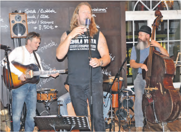
Die Band »Uptown Blues« sorgte bei der »Bluesnight« am vergangenen Freitag im »Goldenen Engel« für mächtig Stimmung unter den Zuhörern.

den zahlreichen Bluesliebhabern ordentlich einheizten, brachten die »Andy Egert Blues Band«, »Uptown Blues« und die »Old Friends Bluesband« die Stimmung im »Nordbahnhof«, im »Goldenen Engel« und im »Weinhaus Baum« zum Kochen. Egal ob Kenner, Neueinsteiger, Einheimische oder Auswärtige - bei der diesjährigen »Bluesnight« war für jeden das Passende dabei. »Die Stimmung