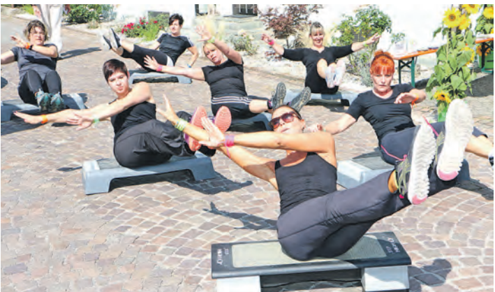
Voller Körpereinsatz: Auch sportliche Besucher kamen beim Stepp-Aerobic auf dem Öhninger Dorffest auf ihre Kosten.

Mehr Bilder gibt es im Internet unter bilder.wochenblatt.net