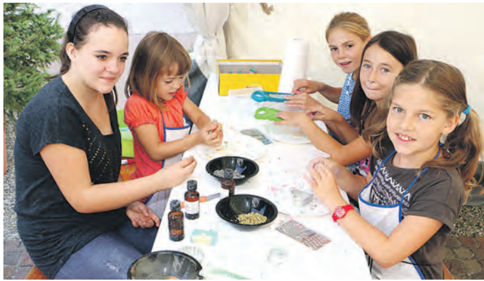
Das Öhninger Dorffest war auch am vergangenen Wochenende einen Besuch wert. Egal, ob für große oder kleine Besucher, wie hier beim Herstellen von eigener Seife, für jeden war die richtige Veranstaltung dabei.