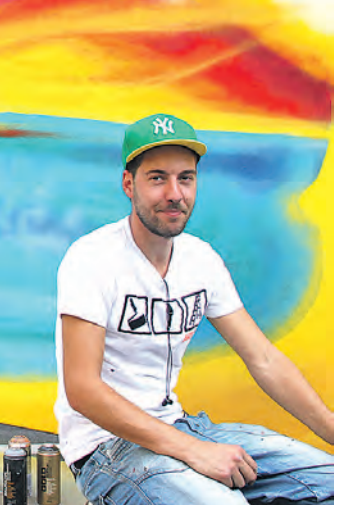
In eine »Bunten Kunstmeile« verwandelte sich die Teggingerstraße beim Altstadtfest in Radolfzell.

Ein weiteres Novum auf dem Radolfzeller Altstadtfest bot sich den Besuchern in der Teggingerstraße, die zur »Bunten Kunstmeile« umgewandelt wurde. Neben Straßenkünstlern und Kunsthändlern konnte sich der Hobbysprayer selbst an den aufgestellten Graffitiwänden austoben. Für die weniger kreativen Schaulustigen eröffnete sich die Möglichkeit, den Künstlern während ihrer Arbeit über die Schultern zu schauen sowie mit ihnen ins Gespräch zu kommen. Gegen Abend verlagerte sich das Hauptgeschehen hin zu den Musikbühnen, auf denen verschiedene Live-Bands bis 22 Uhr für Stimmung sorgten und das Publikum zum Tanzen brachten.