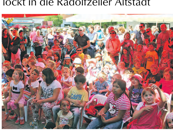
Das Altstadtfest entwickelte sich bei Groß und Klein zum Publikumsmagneten.

Radolfzell (kmk). Als Oberbürgermeister Martin Staab das Radolfzeller Altstadtfest gegen 11 Uhr eröffnete und sich über das herrliche, spätsommerliche Wetter freute, tummelten sich bereits zahlreiche Besucher auf dem Marktplatz. Traditionell findet das Fest am ersten Wochenende im September statt und lockte auch in diesem Jahr Besucher aus der Umgebung vor allem mit seinen künstlerischen und musikalischen Darbietungen in die Radolfzeller City. Zudem sorgte das vielseitige gastronomische Angebot der örtlichen Vereine für das leibliche Wohl der Besucher.