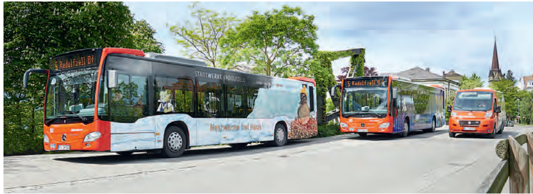
Der Radolfzeller Stadtbus feiert am Samstag, 20. September, sein 20-jähriges Jubiläum. Aus diesem Grund laden die Stadtwerke unter dem Motto »Sonne tanken mit den Stadtwerken« auf den Untertorplatz ein.

Radolfzell (gü). Er gilt seit nunmehr 240 Monaten als Alternative zum Auto. Er hat im vergangenen Jahr 439.000 Kilometer zurückgelegt. Er hat 2013 rund eine dreiviertel Million Fahrgäste begrüßen dürfen. Insgesamt bedient er 178 Haltestellen: 2014 feiert der Radolfzeller Stadtbus sein 20-jähriges Jubiläum. »Stadtbus Radolfzell - die Verbindung mit Ihnen« - unter diesem Slogan nahm die Busflotte am 1. Oktober 1994 ihre ersten Fahrten auf. Heute, 20 Jahre nach der Premierenfahrt, laden die Stadtwerke Radolfzell am Samstag, 20. September, von 10 bis 14 Uhr auf den Untertorplatz und auf den zentralen Omnibusbahnhof (ZOB) ein, um gemeinsam unter dem Motto »Sonne tanken mit den Stadtwerken« mit ihren Kunden den runden Geburtstag des Stadtbusses zu feiern. »Seit 20 Jahren bedient der Stadtbus die Ortsteile von Radolfzell. Am ZOB, direkt am Bahnhof, treffen sich alle Linien. Somit ist der Umstieg auf andere Stadt-