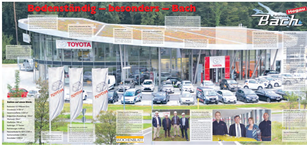
Das neue Autohaus Bach am Toyota-Kreisel. Ein erster Einblick in die umfassende Sonderbeilage, die in dieser Woche dem WOCHENBLATT beiliegt. Durch das neue Konzept enthält es alle notwendigen Informationen zu dem »nachhaltigen und architektonischen Highlight« am Tor der Singener Automeile auf einen Blick.

Ausgehend von der Toyota-Philosophie der Nachhaltigkeit ist die 77 Tonnen schwere Stahlkonstruktion mit Glasflächen von 700 Quadratmetern weit mehr als Verkaufsfläche der umweltverträglichsten Fahrzeugflotte. An einem Top-Standort in Singen ist das Autohaus viel mehr, indem es den modernsten Stand an Umweltverträglichkeit mit architektonischem Esprit vereint, gleichsam Sinnbild der Marke Bach, die zahlreiche Kunden in der