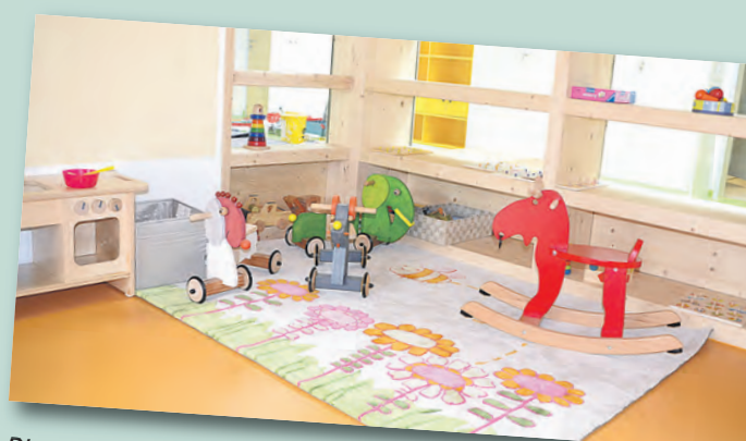
Die neue Kinderkrippe »Alte Ziegelei« in Rickelshausen lädt mit viel Platz zum Toben ein.