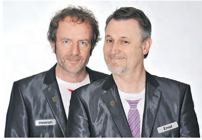
Starke Künstler sind bei »SWR1 lacht« zu sehen. Ernst und Heinrich von der legendären »Kleinen Tierschau« sind dabei ein besonderes Schmuckstück.

Koczwara als Besteller-Autor von »Am achten Tag schuf Gott den Rechtsanwalt« auf. Auch das Comedy-Duo Ernst und Heinrich von der legendären, unerreichten »Kleinen Tierschau« und »Dui do on de Sell«, das zungenfertige Putzfrauen-Duo aus der Friedrichshafener TV-Fasnacht, treten eine Komik-Lawine los.