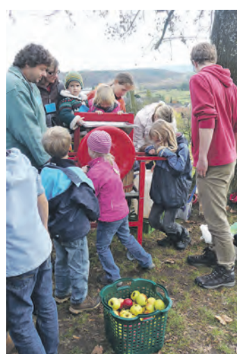
Mit der Hausmose der Abteilung Landschaft und Gewässer ist Saftmachen kinderleicht.

Radolfzell (swb). Der Herbst naht, die Erntezeit für Äpfel und Birnen steht vor der Tür beziehungsweise hat schon teilweise begonnen. Wer schon immer einmal selbst Saft pressen wollte, der hat dazu mit der Hausmose der Abteilung Landschaft und Gewässer, mit der aus Äpfeln und Birnen frischer und leckerer Saft gepresst werden kann, die Möglichkeit dazu. Das Angebot richtet sich vorrangig an Schulen, Kindergärten und andere öffentliche Einrichtungen. Die Mostpresse kann nur einmal und höchstens für eine Woche ausgeliehen werden. Kindergärten und Schulen haben außerdem die Möglichkeit, die »Radolfzeller Streuobstkiste« auszuleihen, mit der ein lehrreicher und spannender Tag für die Kinder garantiert ist.