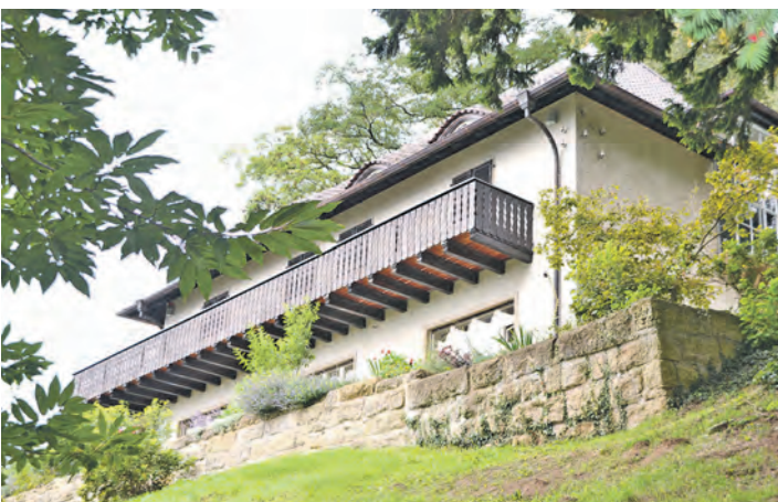
Auf der Höri öffnete unter anderem das Museum Haus Dix in Hemmenhofen beim Tag des Denkmals seine Türen.

Auf der Höri standen das Hermann-Hesse-Haus sowie das Museum Otto Dix mit Garten für die Bevölkerung offen. Besonderer Anziehungspunkt waren die Bilder von Dix, die jahrelang hinter Wandregalen im Keller versteckt gewesen und die bisher im Werkverzeichnis des Künstlers nicht aufgeführt waren.