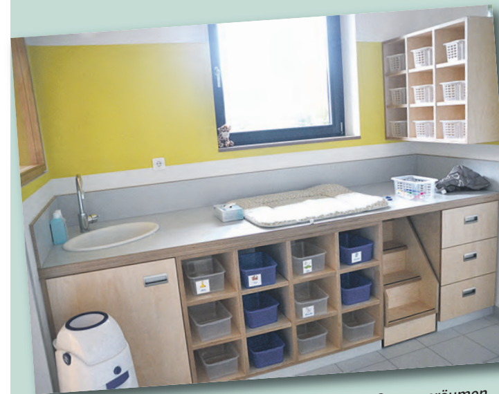
Kein Kinderwunsch bleibt unerfüllt: Neben den Gruppenräumen besticht die Kinderkrippe mit einem neuen Sanitärbereich.