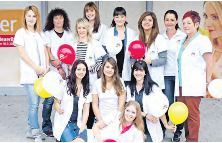
Die Mitarbeiter des neuen dm Marktes in der Werner-von-Siemens-Straße 3 in Rielasingen-Worblingen freuen sich ab der Eröffnung am Donnerstag auf zahlreiche Kunden.