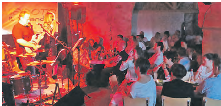
Ein tolles Konzert gab die Band »Miss Otis and friends« im Öhninger Stiftskeller. Veranstalter war der Weinbauverein.