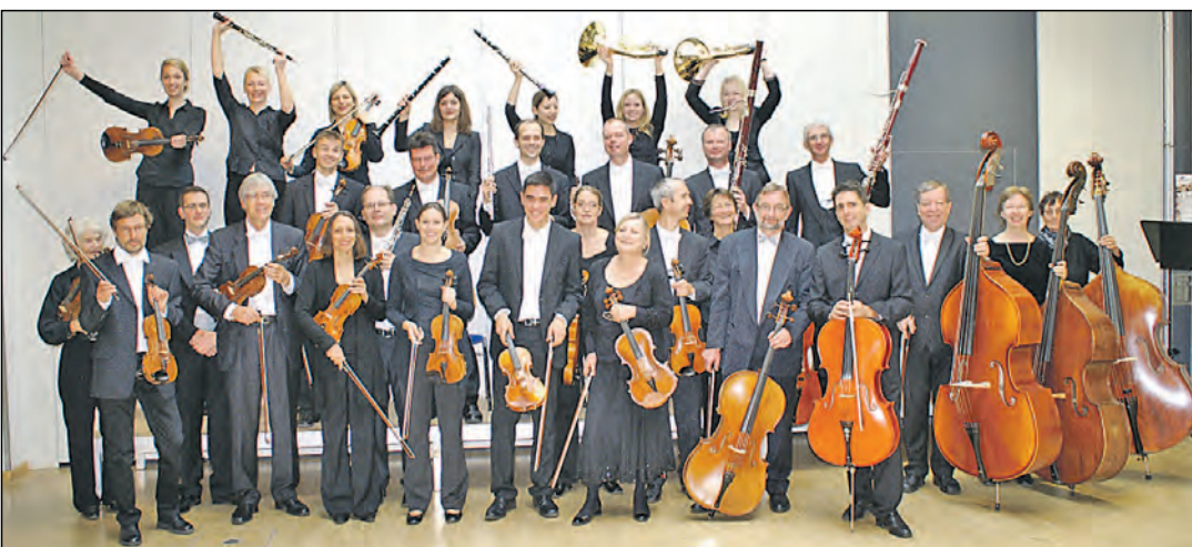
Das Hegau-Bodensee-Orchester konzertiert am Samstag, 4. Oktober, in der Aula des Stockacher »Nellenburg-Gymnasiums«. Um 20 Uhr wird mit der »Egmont-Ouvertüre« von Beethoven begonnen. Es folgen die »Variationen über ein Thema von Haydn« in B-Dur von Brahms, doch Hauptwerk des Konzerts ist die berühmte g-Moll-Sinfonie von Mozart. Karten gibt es an der Abendkasse.