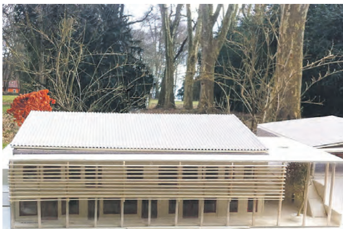
Noch kann das Kinderhaus in Möggingen nur als Modell bewundert werden, doch durch seine Fertigstellung kann die Stadt Radolfzell die örtliche Bedarfsplanung der Kindertagesbetreuung in den kommenden Jahren weiter ausbauen.

Radolfzell (gü). In Sachen Schullandschaft und Kinderbetreuung ist in Radolfzell derzeit vieles im Gange. Neben der geplanten Einrichtung einer Gemeinschaftsschule am jetzigen Standort der Ratoldusschule (das WOCHENBLATT berichtete), wurde in der jüngsten Sitzung des Ausschusses für Bildung, Soziales und Sicherheit auch die Fortschreibung der örtlichen Bedarfsplanung der Kindertagesbetreuung der Stadt diskutiert. Anette Hemmie konnte vor allem in der U3-Betreuung von großen Fortschritten berichten: »Wir können die Versorgungsquote von derzeit 31,2 Prozent bis 2015 auf 35,4 Prozent erhöhen«, erklärte die Fachberaterin Kindertagesbetreuung der Stadt. Aktuell gibt es in der Stadt 214 U3-Plätze in Krippen, Kindertageseinrichtungen und in der Tagespflege. Mit der Aufnahme der Kinderkrippe »Alte Ziegelei« der ARGE Iznang in Böhringen mit zehn Krippenplätzen, deren geplanten Erweiterung um nochmals zehn Krippenplätze zum September 2015, der beantragten Erweiterung des geplanten zweigruppigen Kinderhauses Montessori um eine altersgemischte Gruppe mit 15 Kindern sowie der im Februar eröffneten altersgemischten Gruppe mit zwölf Ü3- und vier U3-Kindern im »Seepferdchen«