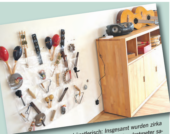
Egal ob musikalisch oder künstlerisch: Insgesamt wurden zirka 347 Quadratmeter neu gebaut und etwa 272 Quadratmeter saniert - da kommen die Kiga-Kids voll und ganz auf ihre Kosten.