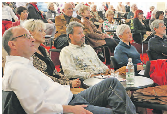
Zahlreiche Bürgerinnen und Bürger interessierten sich am Sonntag für die ersten Ergebnisse und die weiteren Schritte zum Radolfzeller Kulturleitbild.

nale vielfältige Kunst, Kultur und Bildung fördern und unterstützen sowie das kulturelle Erbe und die gelebten Traditionen wie das Hausherrnfest pflegen. Weiterhin soll ein lebenslanges Lernen durch ein individuelles Bildungsangebot ermöglicht sowie eine Plattformen für lebendige Kooperationen geboten werden und man will offen für Neues sein. Darüber hinaus soll »KULTUR Radolfzell« durch ein kreatives, innovatives und zielgruppenorientiertes Kulturprogramm begeistern. Schließlich sieht die letzte Leitlinie nachhaltige und umweltfreundliche Kultur- und Veranstaltungskonzepte vor. In der abschließenden Fragerunde