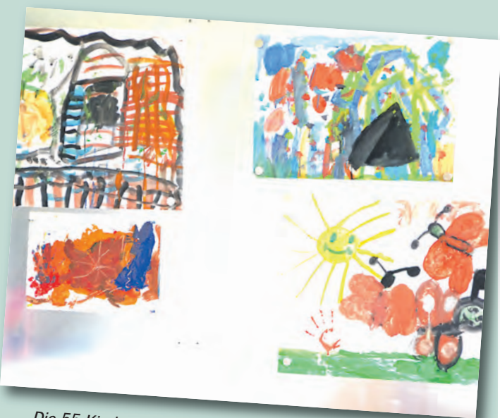
Die 55 Kinder haben sich ihr neues Zuhause schon einmal mit selbst gemalten Bildern wohnlich gemacht.

Die Kinder im Öhninger Kindergarten können sich auf mehr Platz zum Spielen und Toben freuen - insgesamt wurden etwa 347 Quadratmeter neu gebaut und zusätzlich 272 Quadratmeter saniert: Am vergangenen Samstag wurde der Anbau des Kindergartens in Öhningen offiziell bei einem Tag der offenen Tür eingeweiht. Und was in Rekordzeit in den vergangenen fünf Monaten Bauzeit alles erstanden ist, kann sich mehr als sehen lassen. »Der östliche Anbau, welcher Flur und Gruppenräume aufgenommen hatte, war abgebrochen worden. Stattdessen ist ein wesentlich großzügigerer Gebäudeteil entstanden, welcher sich an den aktuellen Anforderungen an solche Einrichtungen orientiert«, erklärt der Öhninger Hauptamtsleiter Uwe Hirt. Das neue Objekt bietet Platz für 55 Kinder, darunter zehn Unter-Dreijährige. Die Baukosten beliefen sich auf 750.000 Euro, so Hirt. Die Baumaßnahme wurde von Architekt Wolf A. Kramer geplant und von Siegfried Pleli als Bauleiter ausgeführt. Der 105 Quadratmeter große Mehrzweckraum für Begegnungen, Bewegungen und Essmöglichkeiten dient im neuen Anbau als zentraler Bereich. Zudem sind zwei Gruppenräume mit je 40 Quadratmetern, ein Schlafraum (23 Quadratmeter), eine Spielfläche sowie ein Kinderwerkraum (21 Quadratmeter) entstanden. »Gemäß Gemeinderatsbeschluss wurde besonderen Wert auf die Verwendung natürlicher Baustoffe, insbesondere Holz, und Energieeffizienz gelegt«, so Hirt weiter. Des Weiteren wurde der vor wenigen Jahren grund-