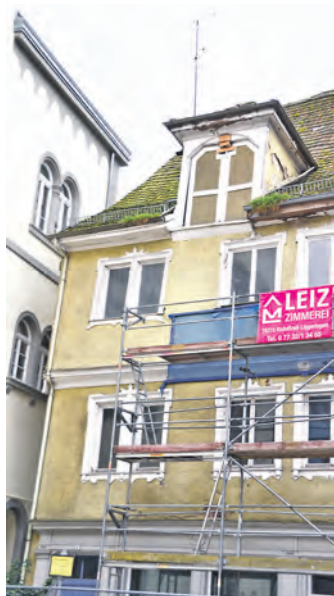
Die zwei Millionen Euro für die Kaufhausstraße 1 seien nicht darstellbar, betonte OB Martin Staab.

Weitaus teurer als die Seetorquerung werde der Bereich Schule- und Kindergarten, in dem die Stadt zwar aufgeholt habe, aber immer noch hinterherhinke, erklärte der OB. Dies betrifft zum einen die Kosten