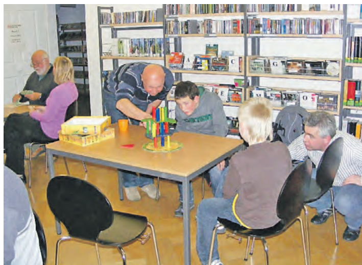
In der Stadtbücherei Stockach wird allerhand gespielt: Am Mittwoch, 5. November, wird in den Räumlichkeiten im Kulturzentrum »Altes Forstamt« in der Salmannsweilerstraße 1 zum Spieleabend geladen.

Stockach (swb). Der Schwarzwaldverein Stockach führt am Samstag, 8. November, eine Wanderung im Bereich Osterholz durch. Treffpunkt ist um 14.30 Uhr am Vereinsheim. Die Wanderung geht je nach Witterung über Schwärzbach, Töbler, Jettweiler, Airach und wieder zurück zum Vereinsheim. Die Gehzeit beträgt etwa 1,5 Stunden, und ab 16.30 Uhr ist Schlachtplattenzeit. Aus organisatorischen Gründen ist eine Anmeldung bis spätestens Mittwoch, 5. November, unter der Rufnummer 07771/28 59 täglich bis 12 Uhr unbedingt erforderlich.