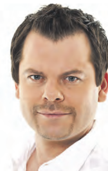
Ein Highlight des Kabarett-Winters ist sicherlich Comedian Ingo Appelt.