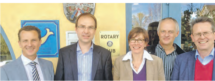
Der Rotary Club Radolfzell-Hegau lädt alle Interessierten zur Foto-Ausstellung »Polio – Das letzte Kapitel« in der Sparkasse Radolfzell ein.

Die Ausstellung in Radolfzell, die eine Auswahl seiner Bilder zeigt, ist bis zum 16. November 2014 in der Sparkasse am Markt zu sehen.