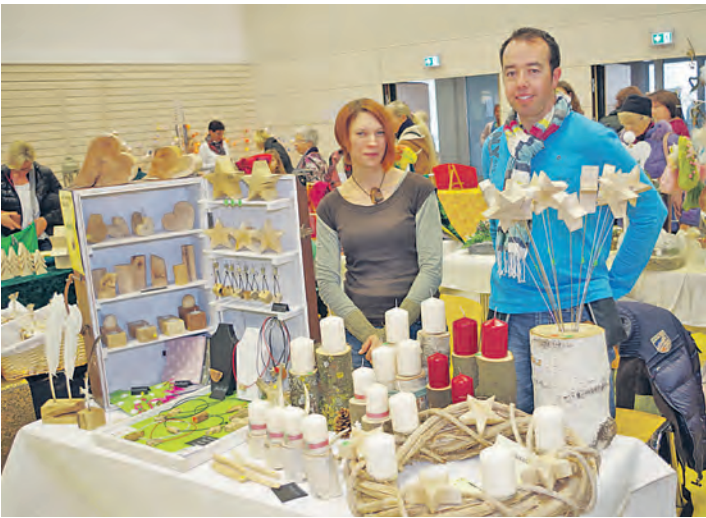
Viele vorweihnachtliche Ideen bot der Kreativmarkt in der Worblinger Hardberghalle auch in diesem Jahr.