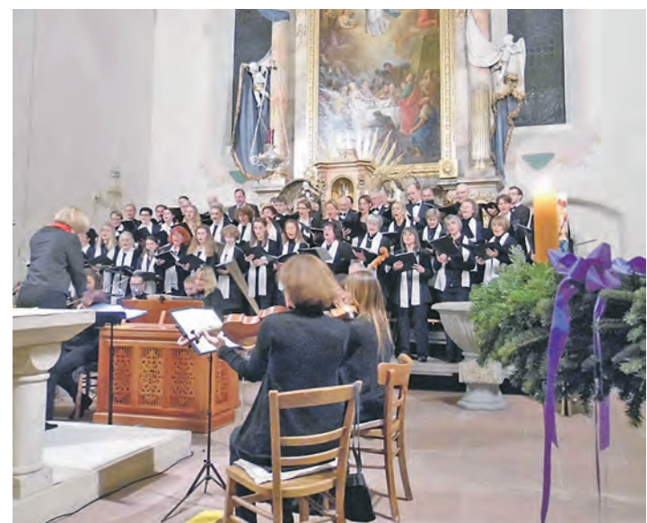
Gemeinsames Singen und Chorgenuss bot das Konzert in der Stadtkirche, das parallel zum Weihnachtsmarkt stattfand.

nach einer gefährlichen Flucht nun endlich im Hegau in Sicherheit und dafür sehr dankbar ist. Bei Liedern wie »Der Morgenstern ist aufgedrungen«, »O Heiland, reiß die Himmel auf«, »Tröstet mein Volk« und »Lobe den Herrn, meine Seele« konnten die Besucher mitsingen. Begleitet wurde die Kantorei von dem Barockconsort mit der Konzertmeisterin Mechthild Werner und den Gesangssolisten. Johann Sebastian Bachs Konzert in A-Dur für die Oboe d' amore inszenierte Michael Küttenbaum perfekt. Natürlich durfte die Titelgebende Kantate, sehr gekonnt von der Kantorei und den hervorragenden Solisten Anja Schwarze-Janka (Sopran), Anne Schmid (Alt) und Clemens Morgenthaler (Bass) vorgetragen, nicht fehlen. Als Abschluss wurde »Dona nobis pacem« (Gib uns Frieden) wieder gemeinsam gesungen. In dieser sehr emotionalen Stimmung zündeten die Besucher in der voll besetzten Kirche Kerzen als Licht des Friedens an.