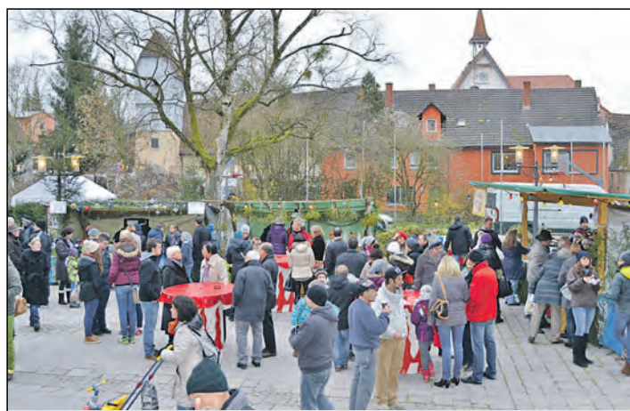
Im Gegensatz zu den anderen Märkten ist der Aacher »Kloosemarkt« kein typischer Weihnachts-, sondern eher ein Krämermarkt, auf dem sich die Besucher am Sonntag mit allerlei Waren, Deko, Gewürzen und Kleidung eindecken konnten. Hinter dem Rathaus und auf dem Mühlenplatz gab es aber auch weihnachtliche Gerüche, selbst gemachte Basteleien und adventliche Klänge von der Stadtmusik Aach.