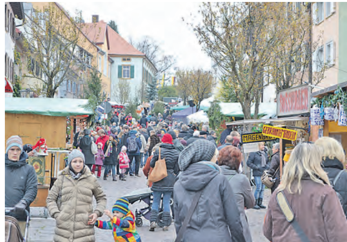
Ein rundum voller Erfolg und eines der »Highlights« im Hegau-Advent: der Weihnachtsmarkt lockte am Wochenende nach Engen.

schenke aus fairem Handel oder von exotischer Herkunft. Umrahmt wurde der alternative Weihnachtsmarkt von einer Menschenkette für den Frieden am Samstag, sowie Märchen, Geschichten, Liedern und einer Lichtershow des Circus Casanietto. Auch beim »normalen«