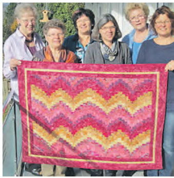
Flink mit der Nadel - die Damen der Patchwork-Gruppe.

Stockach (swb). Quadratisch, praktisch, gut. »Patchwork« ist ein rundum rechteckiges Hobby. In Stockach haben sich in dieser Art engagierte Damen zusammengefunden, die sich nach der Devise »Wir lernen voneinander« regelmäßig treffen. Ihre Arbeiten werden von Freitag, 5., bis Mittwoch, 31. Dezember, zu den üblichen Öffnungszeiten in der Sparkasse in der Schillerstraße in Stockach ausgestellt. Die Ausstellung ist ein Teamwork mit der Kindertagesstätte »Villa Kunterbunt«. Einfach mal reinschauen und sich daran erfreuen! Jedes