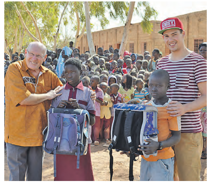
Der Stockacher Verein »Helfen - was sonst« unterstützt ein Schulprojekt in Burkina Faso.

Das Hauptaugenmerk der Vereinsarbeit liegt auf einem Schulprojekt in Ouagadougou. Zu Beginn der Aktivitäten 2006 waren neun Klassenräume geplant gewesen, inzwischen sind es 14 geworden, in denen 764 Kinder unterrichtet werden. Davon gehen 59 Schüler in die Vorschule, 587 in die Primarschule, und 118 Kinder sind auf dem Weg, in der Sekundarstufe