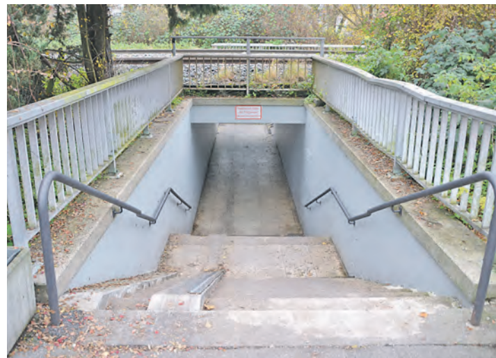
Aufgrund der anstehenden Großprojekte und Kosten von 1,1 Millionen Euro hat die Sanierung der Libellenwegunterführung wohl wenig Chancen auf eine Umsetzung.