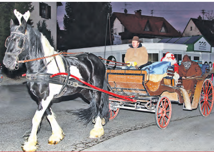
Als Ehren- und Stargast wird Santa Claus in Eigeltingen erwartet.

Axel Baumann. Denn auf dem Weihnachtsmarkt in Eigeltingen können Besucher ausgiebig bummeln.