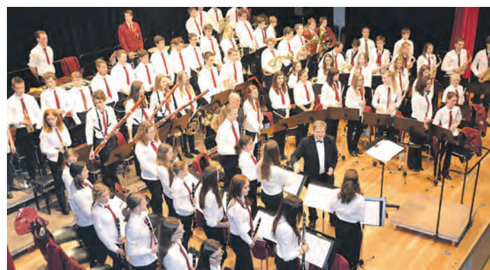
Die Stadtkapelle und das JBO laden am 7. Dezember zu ihrem traditionellen Advents-Benefizkonzert ein.