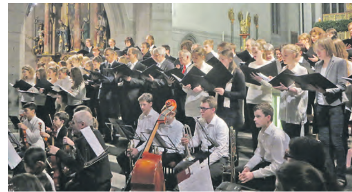
Wie gewohnt überzeugte auch dieses Jahr das Schüler-Eltern-Lehrerorchester und der Chor des Friedrich-Hecker-Gymnasiums mit ihren Weihnachtsliedern das Publikum im Münster ULF und sorgte für vorweihnachtliche Stimmung.

das Ensemble aus Lehrern und Schülern den Zuhörern ein Stück von Giuseppe Sammartini, der Zeitgenosse Vivaldi und J. S. Bachs war. Der Schüler-Eltern-Lehrerchor sang unter dem Motto »Christmas at King's College«, wobei traditionelle englische Weihnachtslieder in zeitgenössischen Sätzen wiedergegeben wurden. Die fröhlichen und zugleich impulsiven Darbietungen fanden seinen Höhepunkt mit dem Lied »Where Riches is Everlastingly« von Bob Chil-