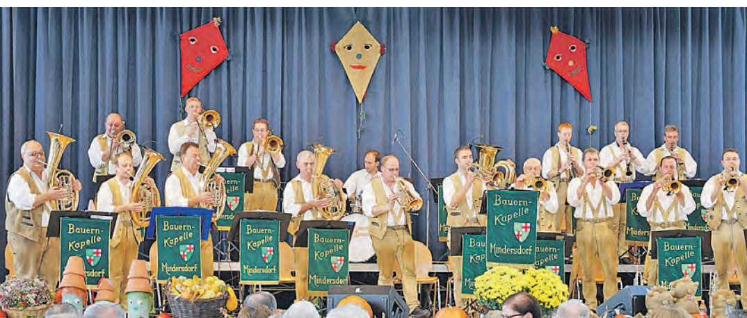
Seit 50 Jahren ein Renner - die Bauernkapelle Mindersdorf.

Ob mit dem Handstandüberschlag, dem Salto auf der Bodenmatte, den Schwüngen und Grätschen an Pferd und Pilz, dem Spagat oder der Laufkippe am Reck, dem Salto auf dem Trampolin oder den gewagten Überschlägen auf dem Schwebelbalken oder den gymnastisch-sportlich-künstlerisch anspruchsvollen Darbietungen der Aerobic- oder Tanzgruppen - die Turnschau war abwechslungsreich und anspruchsvoll. Und die »Nellis« vom »Nellenburg-Gymnasium« gehören einfach dazu, schon personell und ortsverbunden, und sie sind gut. Und dass sich der Nikolaus mit seinem Ruprecht und den rotbemühten Wichteln mit Süßigkeiten und manch mahndem Wort viel Zeit für die Jüngsten nahm, wundert's. Und so glänzend, feurig, farbenfroh und fröhlich tritt James Bond nur in der Heidenfelshalle auf. Mein Name ist Jahn – TV Jahn 08 Zizenhausen.