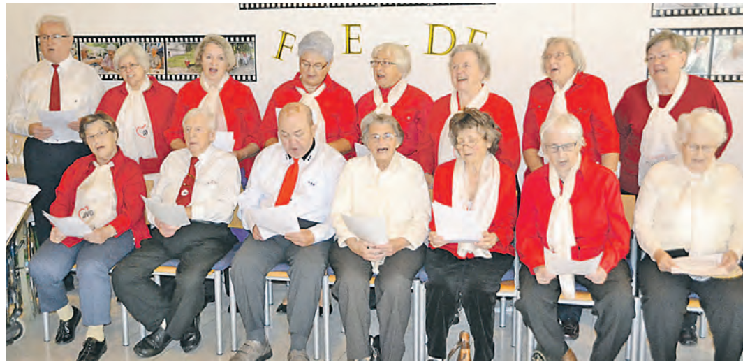
Schwungvolles Jubiläum: Der AWO-Sponti-Seniorenchor aus Radolfzell sang angesichts des 30-jährigen Jubiläums des Mobilen Sozialen Dienstes.

Karten für die Jubiläumsveranstaltungen gibt es unter www.tickets.wochenblatt.net . Mehr Infos zur Bauernkapelle unter www.bauernkapelle.de .