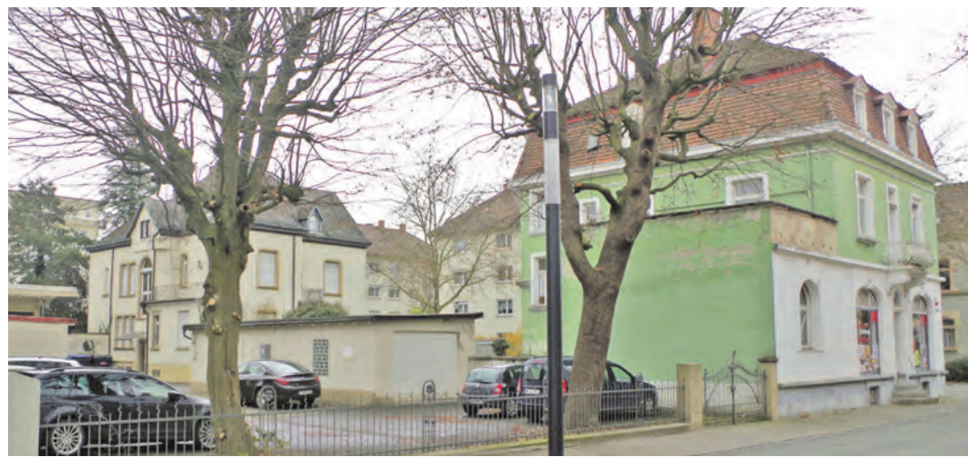
So wechselvoll kann ein Jahr sein. Das an die Stadt Singen vererbte Areal der Wetzstein-Villa in der Singener Innenstadt sollte eigentlich zur Öko-Siedlung für junge Familien umgestaltet werden. Der Plan scheiterte nach dem Realisierungswettbewerb mangels Bauträger. Zwischenzeitlich sollte dort das Projekt »Time out School« des Vereins »Menschen helfen« unterkommen, was durch einen Wasserschaden verhindert wurde. Jetzt bietet die Stadt Singen das Areal einer ökumenischen Interessensgemeinschaft zum Bau eines stationären Hospiz an. Ganz am Anfang der Planungen sollte die Villa (links hinten) übrigens mal Quartier-, Senioren- oder Familienzentrums werden. Das »Grüne Haus« soll durch ein Wohnprojekt ersetzt werden.