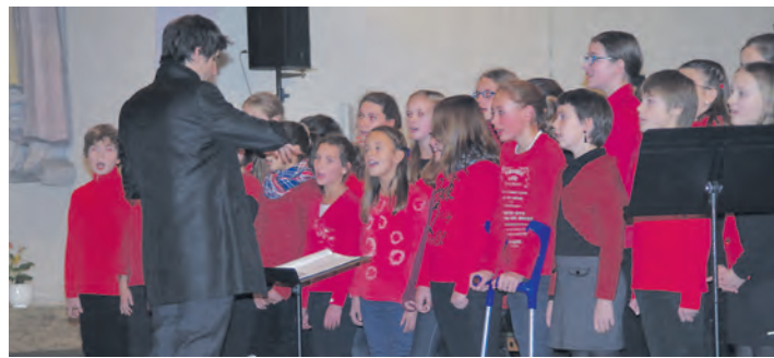
Auch der Unterstufenchor wusste beim »Hegau«-Weihnachtskonzert in der Liebfrauenkirche schon zu überzeugen.

ganze Reihe von Glanzpunkten in dieser Adventnacht gesorgt, doch es ging auch um das anspruchsvolle Gesamtniveau aller Akteure, die zum Teil schon von Orchestermentoren dirigiert wurden. Das Konzert wird den Musikunterricht am »Hegau« auch nachhaltig bereichern, denn die Spenden dieses Abends dienen der Anschaffung eines Marimbaphons.