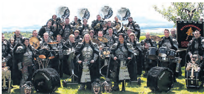
Derzeit zählen die Bittelbrunner Glockästupfer 45 aktive, sowie 35 passive Mitglieder. Wie jedes Jahr sind sie ab November auf die 5. Jahreszeit eingestellt und absolvieren Auftritte in Nah und Fern.

Partyhits überbrückt. Für das leibliche Wohl ist ebenfalls bestens gesorgt. Als weitere Besonderheit wird es von 19 bis 20 Uhr eine Happy Hour geben. Kein Einlass unter 16 Jahren.