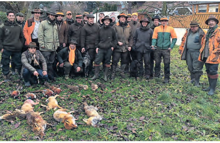
Erstmals wurde eine Drückjagd für Nachwuchsjäger bei Bohlingen veranstaltet.

21 jungen Waidmänner mit ihren fünf Hunden und ihren 18 Treibern und Treiberinnen früh morgens mit der Jagd beginnen. Beste Wetterverhältnisse ließen einen ausgesprochen milden und besonderen Jagdtag zu. Zur Strecke kamen drei Füchse, zwei Hasen, acht Fasane und eine Stockente. Diese wurden beim Strecke legen streng waidmännisch verblasen. Im Anschluss klang der schöne Tag im Jagdhaus aus.