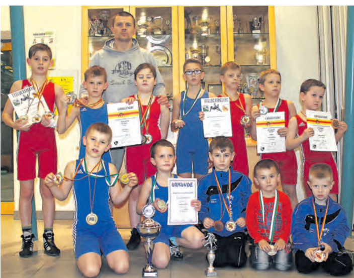
Stolz präsentierten die Nachwuchsringler des Stadtturnvereins Singen ihre Medaillen.