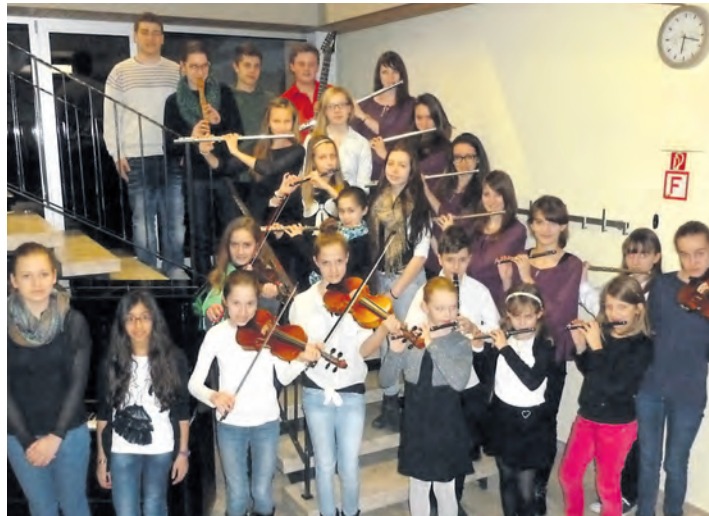
Die Teilnehmer der Jugendmusikschule Westlicher Hegau waren auch in diesem Jahr bei »Jugend musiziert« höchst erfolgreich.