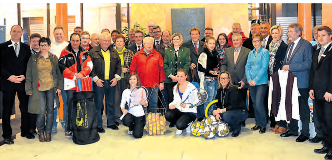
Stolz präsentieren die Vertreter der Volksbank und der Vereine das Ergebnis des Gewinnsparens.

In die guten alten 70er Jahre werden die Gäste der Stammtischfreunde Anselmingen am Fastnachtfreitag, 27. Februar, entführt. Dann steht der Kronensaal in Anselmingen mal wieder im Mittelpunkt der diesjährigen Mottoparty. Angesagt sind Schlaghosen, heiße Miniröcke, Plateauschuhe und lange Haare. Musikalisch regierten der Schlager und der Rock 'n' Roll die Welt. Ab 19.30 Uhr stellt sich die ultimative Schlagershowband des oberen Hegaus, »Thieder Dhommas Cuhn und Bänd«, dem Duell mit »Audesno«, einer 70er Jahre Cover Rock-Band. Das Motto lautet an diesem Abend »Schlager meets Rock 'n' Roll - es kann nur einen geben«. Die größten Hits der heißen 70er werden zu hören sein. Zusätzlich haben sich die Engemer Schätteri Dätscher angesagt, und sie werden den Gästen kräftig einheizen. Statt Eintritt stehen Spendenschweinchen bereit.