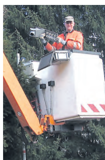
Hell und günstig: Rund 200 Straßenleuchten wurden auf LED umgerüstet.

Zum 1. April verpachtet die Gemeinde für weitere neun Jahre den freigewordenen Gemeindejagdbezirk mit einer Fläche von rund 836 Hektar. Der Gemeinderat genehmigte