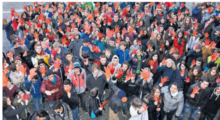
Dieses Bild soll auch an Politiker geschickt werden und zeigt 210 Diessenhofener Sekundarschüler zum »Red Hand Day« gegen Kindersoldaten.

Engen (swb). Am Montag, 10. März, 15 Uhr, liest Christine Grecht-Melzer das entzückende Bilderbuch von Isabel Pin zum Thema Karneval in der Stadtbibliothek Engen vor. Anmeldung in der Bibliothek oder unter Telefon 07733-501839.