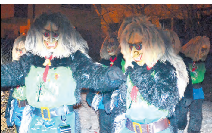
Wildes Hexen-Spektakel in Aach: Bei der 4. Hexen-Nacht am Sonntag schlängelten sich 23 Gruppen mit gut 500 gruseligen Gesellen durch die Stadt, um anschließend bei schrägen Rhythmen ausgelassenen bei der Hexen- und Guggenparty zu feiern.