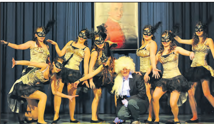
Die Bibernixen mit »Rock me Amadeus« waren ein Höhepunkt beim bunten Abend der Biberjohli in Watterdingen. Mit Witz, Esprit und närrischem Schabernack brachten die Akteure die Biberhalle zum Beben.

Mehr Bilder finden Sie unter www.wochenblatt.net/wbbe-weg/Bildergalerie