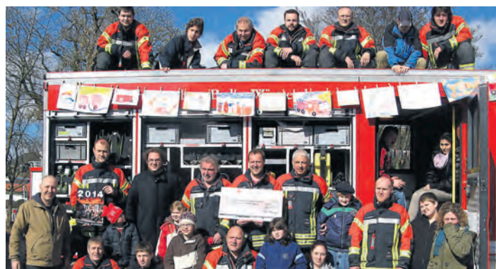
Die Kinder vom Haus am Mühlebach durften einen Einsatzwagen der Freiwilligen Feuerwehr Hilzinger »entern«.

Mühlhausen-Ehingen/Hilzinger (swb). Die Schüler der Heimsonderschule Haus am Mühlebach in Mühlhausen-Ehingen hatten bei ihrem Besuch der Freiwilligen Feuerwehr Hilzinger viel Spaß und konnten zudem eine Spende von 3.700 Euro entgegennehmen. Im letzten Jahr hatte sich hierzu ein Team aus den Reihen der Freiwilligen Feuerwehr Hilzinger vom Fotografen Herbert Hepfer aus Rielasingen rund um das Thema Feuerwehr. Die 13 besten Motive wurden mit Hilfe des Hilzinger Grafikers Martin Rieger in ein professionelles Kalender-Layout gesetzt – natürlich ehrenamtlich. Zur Hilzinger Kirchweih begann der Verkauf des Fotokalenders – aktiv betrieben vom gesamten Kalenderteam. Allen