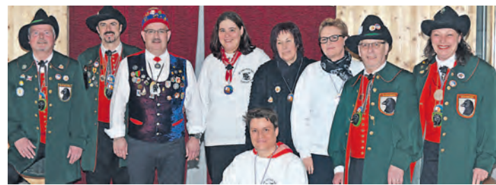
Die Geehrten der Quakenzunft EHINGEN.

MUSIKVEREIN Die Generalversammlung des Musikvereins Zimmerholz muss wegen Terminüberschneidung verlegt werden. Der genaue Termin wird noch bekanntgegeben.