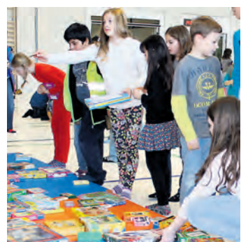
Ganz viele Spielsachen blieben bei der Börse der Diessenhofer Schulgemeinde für Kinder in Osteuropa übrig.

In der Aula des Schulhauses Zentrum boten rund 80 Kindergärtler und Erstklässler und in der Lettenhalle etwa 150 Zweit- bis Sechstklässler Spielsachen an. Sie breiteten ihre Schätze auf dem Boden aus, geordnet nach Themen wie Spiele, Plüschtiere oder Bücher. Die VSGDH hatte die Kinder eingeladen, für die Tauschbörse je zwei bis sechs Spielzeuge in die Schule zu bringen. Dort gaben die Lehrpersonen für je zwei gut erhaltene Tauschobjekte einen Bon ab, maximal deren drei pro Kind. Das Bonsystem, 1 Spielzeug für zwei, ergab, dass die Hälfte der etwa tau-