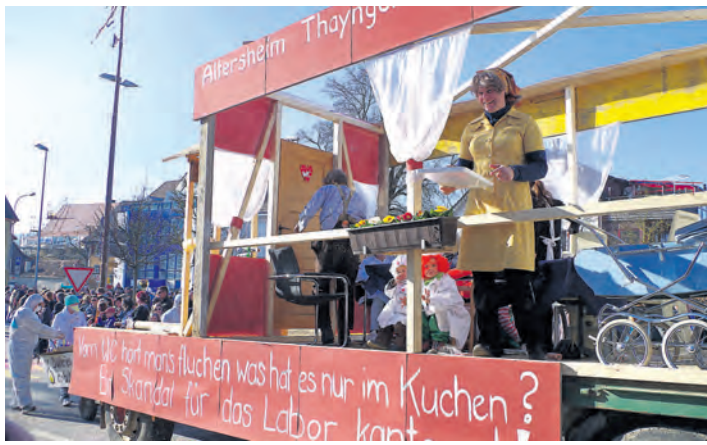
Die Sperrungen des Alterswohnheims wegen Infektionen hatten sich die Barzheimer Narren als Thema für ihren diesjährigen Wagen ausgesucht.

Thayngen (of). Einen Umzug mit einer Rekordkulisse erlebte die von der Guggenmusik Drachäbrunnächchrächer veranstaltete Thaynger Fastnacht. Einige tausend Besucher säumten die Straßen zum großen Umzug am Samstag, nachdem sich der Ort bereits am Donnerstag mit einem Hemdglonkerball auf die närrische Saison eingestimmt hatte. Rund 60 Gruppen waren beim närrischen Lindwurm am Samstagnachmittag dabei, darunter erfreulich viele Sujetwagen von Fastnachtsgruppen, die nicht mit Konfetti sparten. Zur Thaynger Fastnacht gehört indess, dass auch lokale Themen auf die Schippe genommen wurden. Unter dem Motto »Jedem Schweinchen ein Scheinchen« wurden die Schweizer Banken durch die Gruppe Winzeler mit einem großen Wagen auf die Schippe genommen. Die »Quarantäne« des Alterswohnheims, das wegen Infektionsgefahr einige Wochen nicht besucht werden konnte, hatten sich die Barzheimer auf die Schippe genommen. Der Thurnverein Thayn-