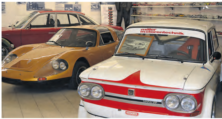
Tolle NSU-Oldtimer gab es bei der Sonderausstellung der Oldtimerfreunde Engen zu sehen.

Ungefähr 25 verschiedene Modelle von NSU haben nun ihren Weg nach Engen gefunden. Vom Fahrrad über Motorroller und -räder bis hin zu diversen Kfz-Modellen und heute noch fahrtüchtigen Rennwagen haben die Mitglieder eine umfassende Dokumentation der Marke zusammengetragen. Das Museum wird gut angenommen; seit der Eröffnung wurden bereits mehr als 600 Besucher gezählt. Zur Ausstellung am Sonntag nutzten zahlreiche Oldtimer-Freunde das frühlingshafte Wetter für eine Ausfahrt und kamen mit ihren eigenen, teils historischen, Schmuckstücken.