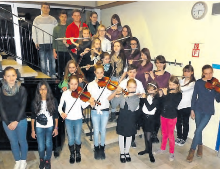
Die Jugendmusikschule Westlicher Hegau lädt zu einem Konzert der Preisträger von »Jugend musiziert« ein.

gend musiziert beachtliche Preise erspielt. Aus ihrem Programm werden jeweils Ausschnitte mit hoch interessanter Instrumental- und Gesangsliteratur aus fünf Jahrhunderten zu hören sein. Die Bevölkerung ist dazu herzlich eingeladen. Der Eintritt ist frei. Die Musiker und Sänger würden sich mit ihren Lehrern über eine kleine Spende sehr freuen.