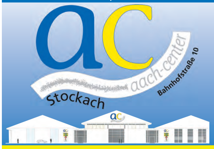
Foto-Session für guten Zweck

Mo. – Fr. 8 bis 22 Uhr, Sa. 7.30 bis 22 Uhr