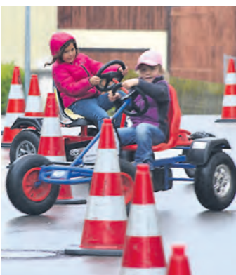
Auch die kleinen Besucher hatten ihren Spaß.

www.wochenblatt.net/wbbewegt/bilder-galerien/das-jahr-2014/april.html