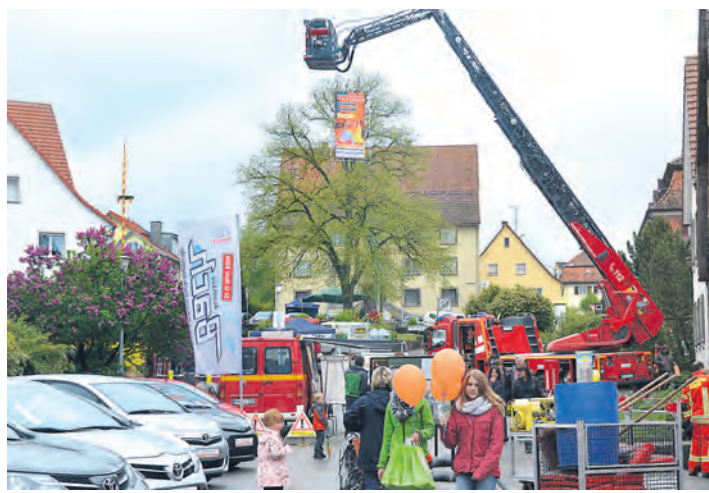
Ein Bummel durchs Altdorf lohnte sich am Sonntag.