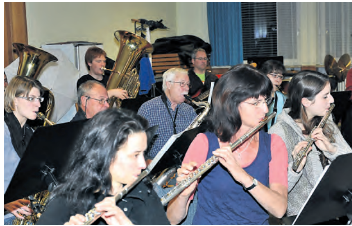
Die Stadtmusik Engen e. V. spielt am Samstag, 10. Mai, einen bunten Strauß an Melodien.

dem Film »Meerjungfrauen küssen besser« eröffnen. Außerdem haben die Jugendlichen ein Medley aus den Welthits von Carlos Santana sowie Hits aus der Fernsehserie »Glee Showstoppers« vorbereitet. Die Stadtkapelle eröffnet den zweiten Konzertteil mit »Hootenanny«. »Xylo Classics« – kein Stück wäre besser geeignet, um das Schlagzeugregister, speziell die Xylophone, in Szene zu setzen. Die Polka »Ein halbes Jahrhundert« und der »Fliegermarsch« stehen ebenfalls auf dem Programm.