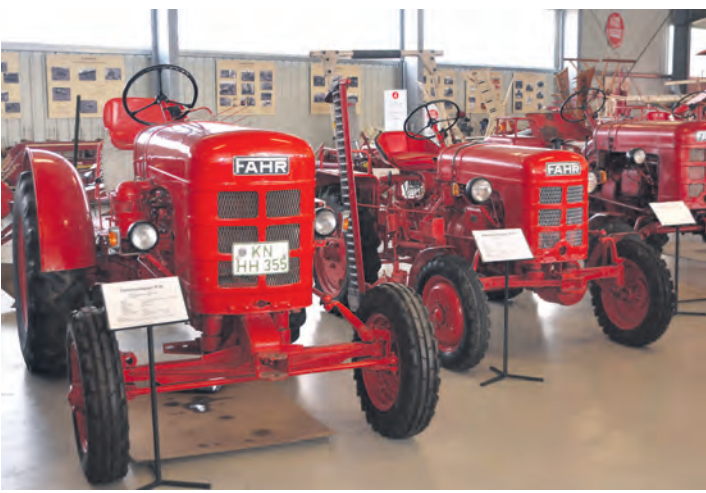
Ein Blick durch die Ausstellungshalle der FAHR-Schlepper-Freunde Gottmadingen.