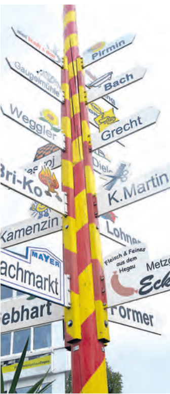
Die Altdorfer Vielfalt.