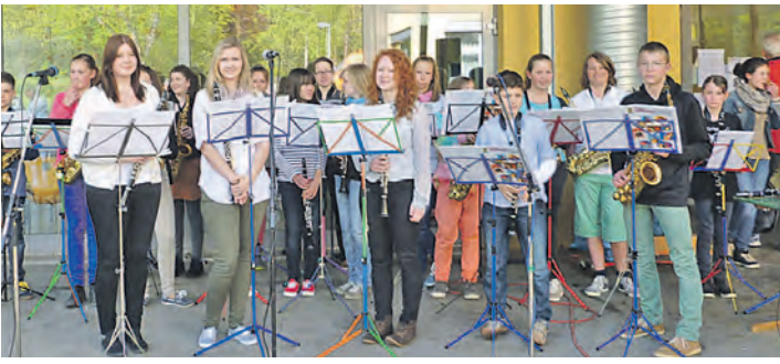
Ein Konzert der Jugendmusikschule Westlicher Hegau findet am 17. Mai in der Rielasinger Ten-Brink-Schule statt.