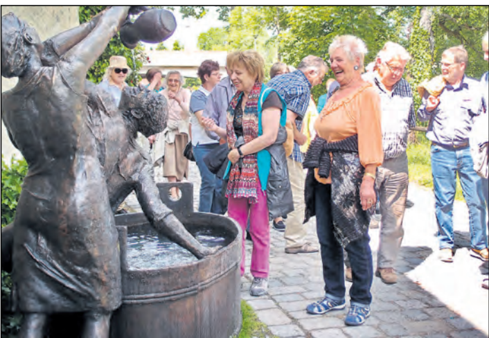
Bei strahlendem Sonnenschein machten sich 50 gut gelaunte Seniorinnen und Senioren aus Mühlhausen-Ehingen zusammen mit Bürgermeister Hans-Peter Lehmann auf die Reise nach Bad Wurzach im Allgäu. Dort fuhren sie mit dem Torfbähnle durch das Wurzacher Ried, besichtigten das Moormuseum, und anschließend ging es weiter zur Stadtführung nach Wangen. Auf dem Rückweg wurde in Kressbronn noch Halt gemacht, bevor es wieder nach Hause in Richtung Hegau ging.