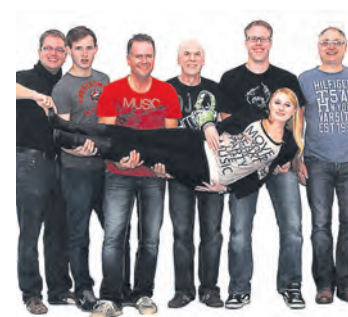
Mit der Band »Crossage« startet der Gottmadinger Kultursommer im Höhenfreibad am 27. Juni.

Gottmadingen (swb). Der Auftakt des Kultursommers im Gottmadinger Höhenfreibad startet nun am Freitag, 27. Juni, mit dem vom Förderverein des Höhenfreibades organisierten Konzert der Band »Crossage«. Fest gebucht sind auch die Filmbeiträge für die beiden Open-Air-Kinoabende im Höhenfreibad. Am Freitag, 4. Juli, erwartet das Publikum die Verfilmung des Romanbestsellers »Der Hundertjährige der aus dem Fenster stieg und verschwand«. Zum Auftakt der Sommerferien folgt am 31. Juli die Komödie »Fack Ju Göthe«. Doch zuerst wird am Freitag ab 20 Uhr im noch leeren 50-Meter-Becken des Höhenfreibades die siebenköpfige Band »Crossage« einheizen. Die Band vereint Vollblutmusiker unterschiedlichen Alters aus verschiedenen Jahrzehnten. Und dieses Thema zieht sich auch durch die Musik: Von den Beatles über U2 und Pink Floyd