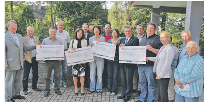
Die vier Vertreter der örtlichen Schulen mit ihren Fördervereinen konnten in Rielasingen durch die Bürgerstiftung im Rahmen ihrer Jahresausschüttung bedacht werden.