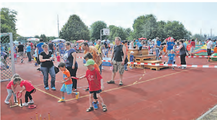
Viel Spaß hatten die kleinen Turnzwerge in Engen.