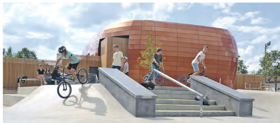
Die neue Skateranlage bei der Stadthalle wird von den Jugendlichen in Engen gerne und oft genutzt.

Auch die Platzprobleme im Jugendtreff »Milchhäusle« beschäftigen den Gemeinderat die letzten Jahren. Mehrere Alternativen wurden diskutiert und verworfen. Nun scheint das ideale Projekt gefunden: In den Räumen des katholischen Gemeindezentrums nahe dem Stadtgarten wird der Jugend-