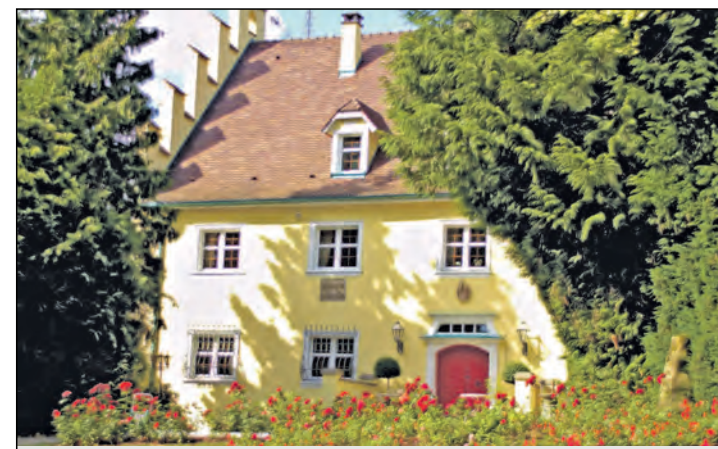
Sommerkonzert im Schlossgarten: Der Musikverein Bietingen lädt am Samstag, 12. Juli, zum Schlossgartenkonzert in den Garten des Bietinger Schlosses ein. Ein besonderer musikalischer Genuss für alle, die schon immer hinter die hohen Schlossmauern schauen wollten. Beginn ist ab 18 Uhr mit einem Aperó.

Bietingen (swb). Auch in diesem Jahr erwartet die Besucher des Sommerfestes des TV Bietingen ein buntes Programm. Am Sonntag, 13. Juli, um 9.30 Uhr treffen sich die Wanderer und Radfahrer an der Turnhalle. Ab 10.30 Uhr startet auf dem Sportplatz das Freizeit-Volleyball-Turnier unter Beteiligung der örtlichen und befreundeten Vereine. Über Mittag werden alle Beteiligten kulinarisch verwöhnt. Spiel und Spaß für Kinder stehen von 11 bis 16 Uhr auf dem Programm. Die Tanzgruppen »Honeymoons« und »Crazy Steppers« präsentieren sich um die Mittagszeit. Mit der Siegerehrung des Volleyball-Turniers geht das Sommerfest rechtzeitig zu Ende, damit jeder das WM-Endspiel ansehen kann. Bei Regen findet ein eingeschränktes Programm statt. Infos: www.tv-bietingen.de.