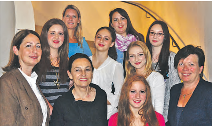
Eine perfekte Gemeinschaft: Die Zontians begleiten die Achtklässlerinnen beim Projekt »Fit fürs Leben«.