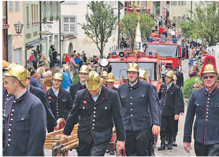
Zahlreiche Zuschauer verfolgten den beeindruckenden Autokorso altertümlicher und neuzeitlicher Fahrzeuge durch die Engener Altstadt.