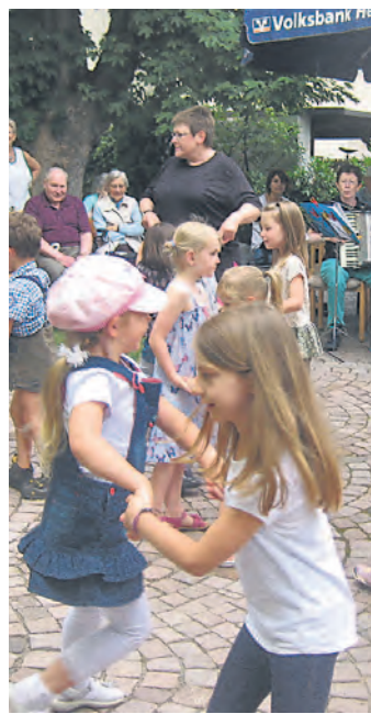
Die Früherziehungsgruppe der Musikschule stellte tänzerisch Frühling und Sommer dar.

Singen (swb). Unter der Leitung der Geschwister Berger von der Musikschule Singen, kamen viele junge Musiker am Samstag, 28. Juni, zum Vorspielen in das Altenheim St. Anna. Im vollbesetzten Garten der Musikschule bekamen die Akkordeonspieler, die Flötenspieler und Geiger viel Applaus von den Heimbewohnern, Eltern und Besuchern. Die Früherziehung stellte den Zuschauern tänzerisch den Frühling und den Sommer dar.