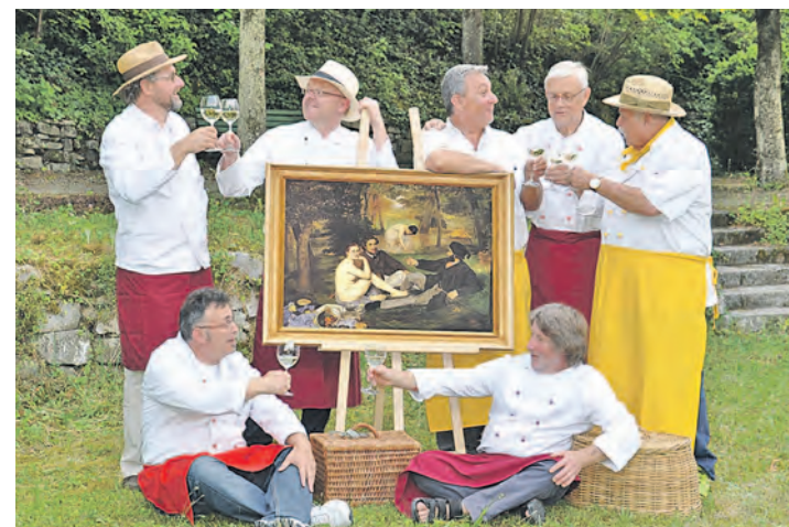
Die kreativen Köche zaubern in der Engener Krankenhaus-Küche zum Thema «Sommer auf dem Lande».