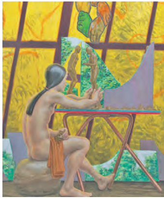
Simon Pasieka, Dritte Hand, Öl auf Leinwand, 2014 wird bei der Ausstellung gezeigt.

Auf den ersten Blick strahlen die Arbeiten Pasiekas – nicht zuletzt vor dem Hintergrund zeitaktueller Kunst – eine ungewöhnliche Ruhe und Harmonie aus. In einer vordergründig realistischen Malweise zeigt er Jugendliche, die inmitten einer beschaulichen Natur rituell wirkende Handlungen herantreibender Adoleszenz vollziehen. Sie spielen Flöte, schauen in die Sterne oder bemalen ihre Gesichter. Doch die Natur, die sie spielerisch zu erspüren scheinen, zeigt die Überreste einer untergegangenen Zivilisation, aus deren Relikten die jungen Menschen das Material für ihre ganz eigene, neu zu erschaffende Welt beziehen. Die kulturellen Codes der Vergangenheit haben ihre Gültigkeit verloren. An ihre Stelle tritt das tastende Experiment, die unvoreingenommene Selbsterfahrung, die unmittelbare Gegenwartigkeit.