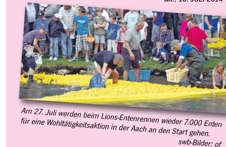
Am 27. Juli werden beim Lions-Entenrennen wieder 7.000 Enten für eine Wohltätigkeitsaktion in der Aach an den Start gehen.