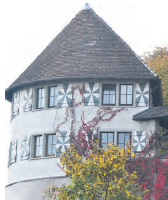
Im oder vor dem Schützenturm finden die Engener Kurzfilmtage an diesem Wochenende statt.