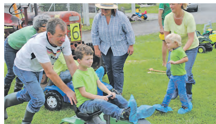
Grenzenlosen Spaß bot die Dorfolympiade in Gailingen: Bei der Spielstation »Bauernhof« befindet sich Mannschaft »Zuka« auf dem Rückweg mit dem Traktor.

Diejenigen die außer Konkurrenz mitspielen wollten, konnten sich mit einer »Spielstrasse für Jedermann« verweilen und auf dem Pausenplatz der Hochreinschule lockte die Festwirtschaft mit dem Duft von Bratwürsten, Steaks und musikalischer Unterhaltung. Entlang des Parcours ging es um sechs originelle Aufgaben. Zur Auswahl standen »lustige Wasser-