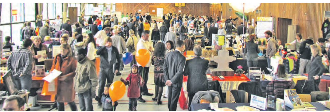
Anmeldung für die Tischmesse am 15. November in der Neuen Stadthalle bei der Wirtschaftsförderung der Stadt Engen.

Es ist geplant, alle Filme auf einer Großwand im Freien auf dem Platz vor dem Schützenturm zu zeigen. Sollte das Wetter nicht mitmachen, so kann auch ins »Türmle« umgezogen werden. Wie es sich für ein Geburtstagsfest gehört, wird eine Bewirtung geboten.