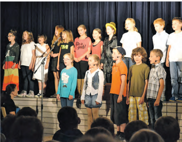
Seit Monaten hatte die Chor-AG der dritten und vierten Klasse an der Mühlhauser Grundschule fleißig für das Musical »Die Rückkehr der Zeitmaschine« geprobt. Es hat sich gelohnt, denn die Zuschauer in der vollen Mägdeberghalle waren begeistert von den tollen Leistungen der rund 50 Mitwirkenden.