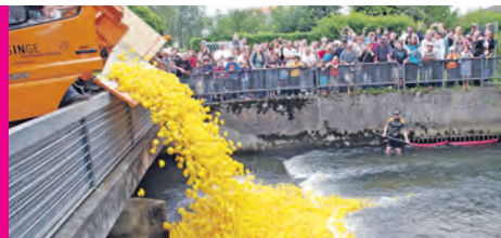
Mi., 16. Juli 2014