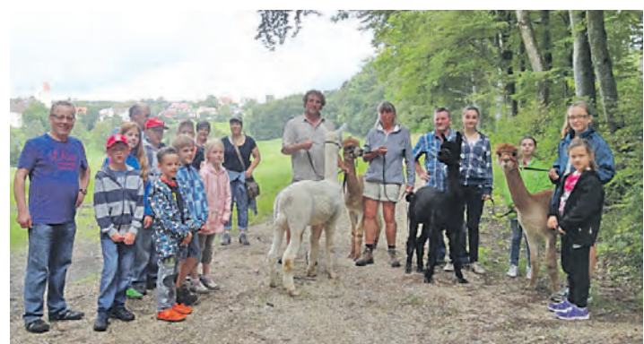
Viel Spaß hatten die Kinder mit ihren Betreuern auf dem Alpaka-hof in Eigeltingen.

Bei einem weiteren Programmpunkt nähten Mädchen kleine Säckchen, die mit der weichen Wolle der Alpakas gefüllt wur-