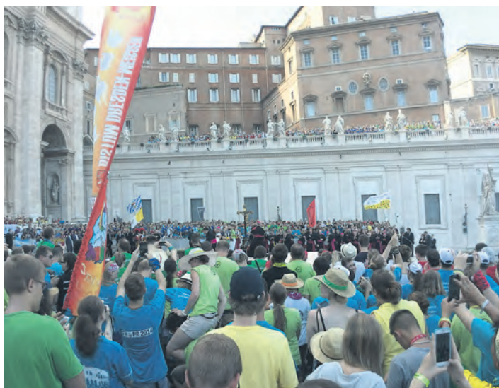
Höhepunkt der Rom-Wallfahrt war die Papst-Audienz auf dem Petersplatz.