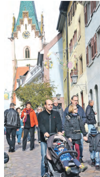
Bummeln und genießen ist beim 4. Oktoberle am Sonntag in Engen angesagt.

mehr können die Oktoberle-Besucher von nah und fern mit dem Bummel durch die Geschäfte und Altstadtgässchen verbinden.