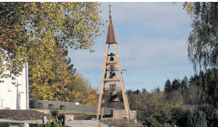
Besonders die Restaurierung und Sanierung von denkmalgeschützten Gebäuden wird bei »Holzbau Massler« großgeschrieben. Derzeit wird unter anderem an der Sanierung des ehemaligen Chorherrenstiftes in Öhningen mitgewirkt.