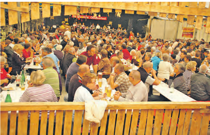
Beste Stimmung im Zelt garantiert das Wiechser Oktoberfest.

Die kostenfreie Veranstaltung richtet sich an Unternehmer und Führungskräfte aus dem Hegau und beginnt um 19 Uhr im Feuerwehrhaus in Engen. Im Anschluss besteht die Gelegenheit, sich bei einem kleinen Umtrunk mit dem Referenten und anderen Teilnehmern auszutauschen. Aus organisatorischen Gründen ist eine Anmeldung bis 9. Oktober unter Telefon 07733/502212 oder formlos per E-Mail an PFreisleben@engen.de erforderlich.