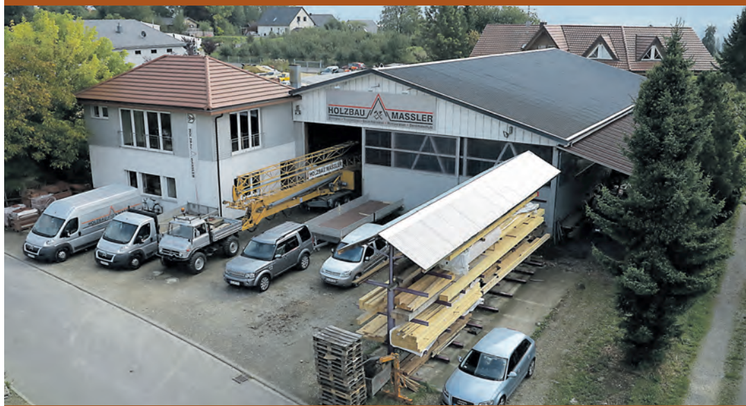
Im Laufe der Jahre hat sich »Holzbau Massler« stets weiterentwickelt und vergrößert: Heute präsentiert sich das Familienunternehmen im einheitlichen Design.