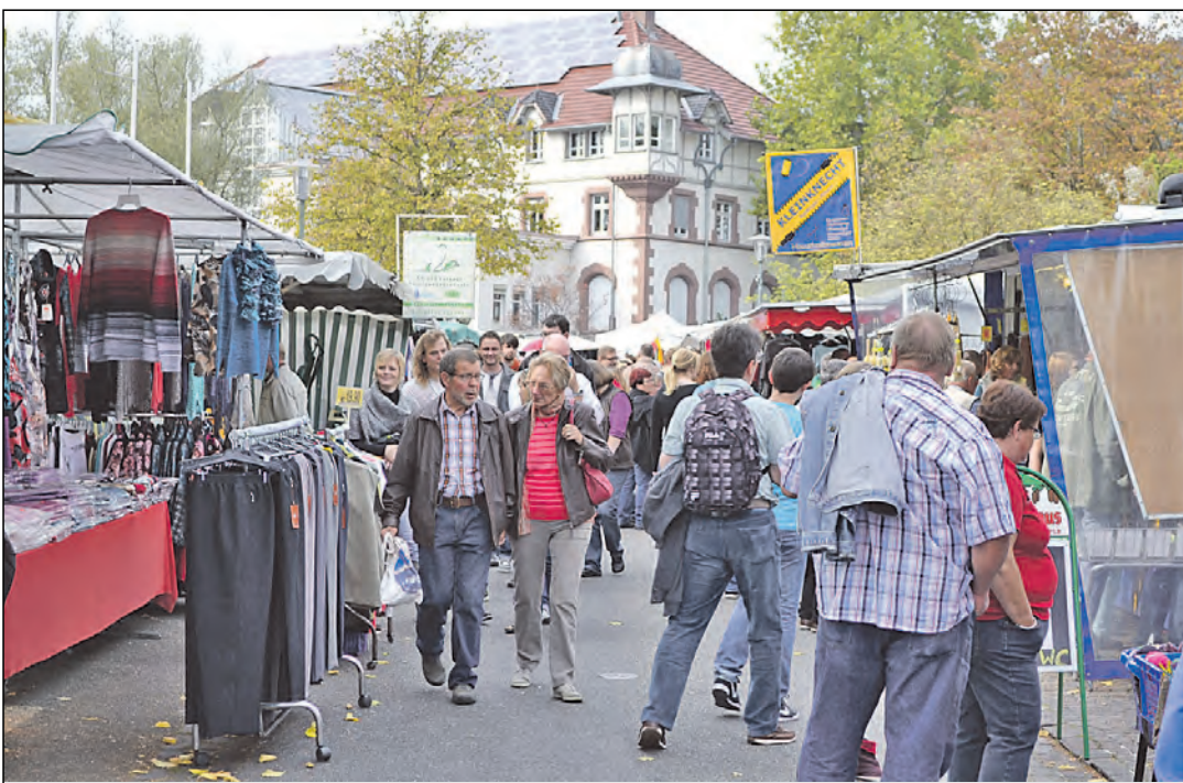
Am Wochenende lockte der große Herbstmarkt mit 170 Ständen die Besucher wieder einmal in Scharen nach Gottmadingen. Jung und Alt konnten nach Herzenslust bummeln. Weitere Bilder auch online unter www.wochenblatt.net/bilder