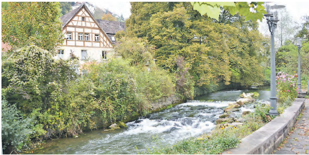
Noch gibt es in Aach viele ungenutzte Möglichkeiten für Versorgung, Tourismus, Wohnen und Barrierefreiheit. Um diese besser nutzen zu können, hat die Stadt die Aufnahme in das Landessanierungsprogramm 2015 beantragt.

Aach (sam). Etwas verwunschen ist der Eindruck, den der Ortskern beim durchfahrenden Besucher hinterlässt, während die Oberstadt durch mittelalterliches Flair beeindruckt. Wie bereits berichtet, wurden im Gemeinderat die Weichen für eine Verschönerung der Ortsmitte gestellt. Hierfür werden Mittel aus dem Landessanierungsprogramm 2015 beantragt. Nicht nur Bürgermeister Severin Graf hat schon viele Ideen. Auch ein Bürgerworkshop mit zwei Arbeitsgruppen trägt einige Anregungen bei. Eine Entscheidung, ob Mittel gewährt werden, wird im Frühjahr nächsten Jahres fallen. Ziel soll eine nachhaltige Aufwertung der Ortsmitte sein. Schwerpunkte sind dabei der Ausbau und die Stärkung der Bereiche Wohnen, Grundversorgung, Verwaltung, Gemeinbedarf, Tourismus und Infrastruktur. Konkret geht es bei diesem Projekt um die Bündelung von Potentialen, die auch durchaus vorhanden sind. Dazu wurde unter der Leitung der