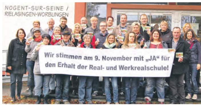
Mitglieder der Initiative für den Erhalt der Real- und Werkrealschule beim Gruppenbild vor der Ten-Brink-Schule.

Real- und Werkrealschule.« Knapp 10.000 Wahlberechtigte gibt es in der Doppelgemeinde. Die aktuell gültigen Regeln schreiben ein Quorum von 25 Prozent, sprich 2.500 Stimmen vor, die die obige Frage mit »Ja« beantworten müssten. Nur dann wäre das Bürgerbegehren erfolgreich. Fast zeitgleich hatte sich im Mai eine »Elterninitiative pro Gemeinschaftsschule« gegründet, die dazu aufruft mit »Nein« zu stimmen, um dadurch den Weg für die Gemeinschaftsschule frei zu machen. Da im Vorfeld der Abstimmung mit manch harter Bandage gekämpft wurde, hat das WOCHENBLATT beiden Initiativen die selben Fragen gestellt. Sie sind hier zum Vergleich abgedruckt.