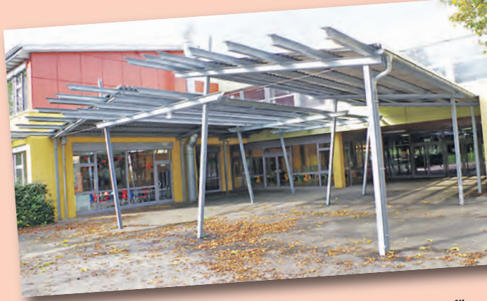
Zwischen den Klassenzimmern wurden zusätzlich Räume für Besprechungen und kleinere Gruppen geschaffen.