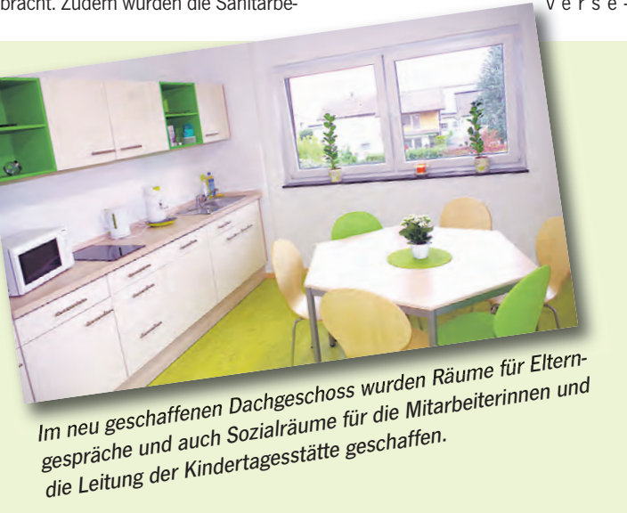
Im neu geschaffenen Dachgeschoss wurden Räume für Elterngespräche und auch Sozialräume für die Mitarbeiterinnen und die Leitung der Kindertagesstätte geschaffen.