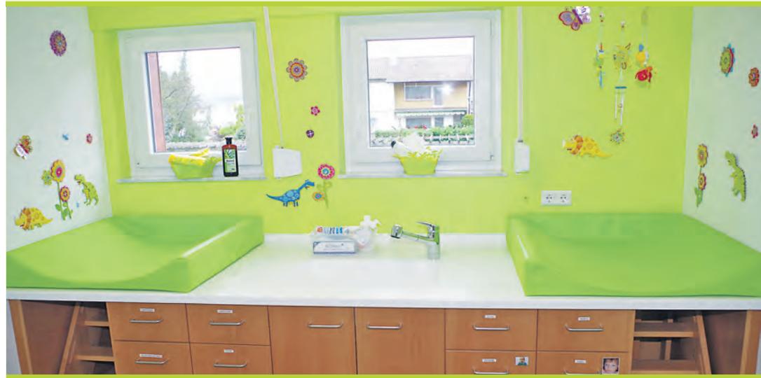
Für die Kleinkindbetreuung ab 2 Jahren wurde ein schöner Wickelraum eingerichtet. Auch der Sanitärbereich ist nun auf die kleinsten Besucher eingerichtet.

Wir wünschen den Kindern viel Spaß in den neuen Räumen.