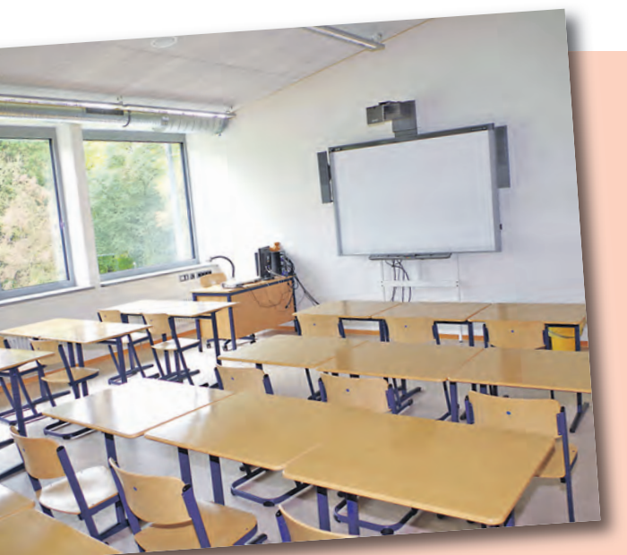
In den neuen Klassenräumen wird natürlich schon auf Smart-Boards unterrichtet. Dafür ist die Ten-Brink-Schule eine der Referenzschulen in Baden-Württemberg.