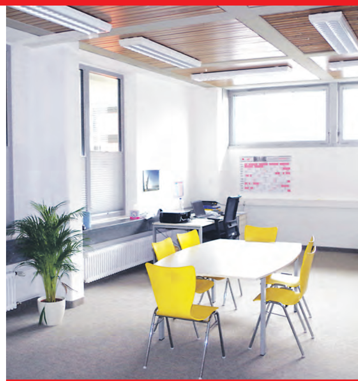
Auch ein großzügiges Büro für die Schulsozialarbeit wurde mit dem neuen Anbau geschaffen.

trifft zum einen eine energetische Sanierung an Fassaden und Dach, die Erneuerung der Elektro-, Heizungs-, Lüftungs- und Sanitärinstallationen. Im jetzigen baulichen Zustand wäre der Schultrakt nur noch rund zehn Jahre nutzbar, wurde erklärt. Dazu kommen noch immens hohe Energiekosten. Für die Sanierung der Schulsporthalle werden derzeit etwa 2,1 Millionen Euro an Sanierungskosten veranschlagt. Diese Maßnahme soll im Jahr 2017 in Angriff genommen werden und 2018 abgeschlossen sein, so der Zeitplan. Die Kosten kann die Gemeinde trotz der hohen Summe aus ihren Rücklagen decken.