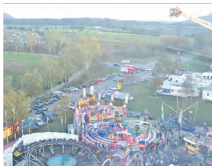
Eine tolle Kulisse mit großem Krämermarkt, spannendem Vergnügungspark, gemütlichem Festzelt und interessanter Gewerbeschau bot der diesjährige Schätzelemarkt in Tengen seinen Besuchern. Vor allem am Sonntag war die 724.

Gottmadingen (swb). Seit kurzem weisen Hinweistafeln an den Ortseingängen auf den nahenden Brettlermarkt (Skibörse) hin. Dieser findet statt am Samstag, 8. November, in der Eichendorffhalle. Der Veranstalter ist die Ski-MaXi-Carvingschule e. V. Die Skilehrer und Helfer nehmen die im sauberen und einwandfreien Zustand befindlichen Winter-sportartikel von 10 bis 12 Uhr an. Der Verkauf der angenommenen Artikel ist dann von 14 bis 15 Uhr. Die Abholung der nicht verkauften bzw. verkauften Artikel ist an gleicher Stätte von 16 bis 16.30 Uhr. Das MaXi-Cafe ist zu den genannten Zeiten geöffnet.