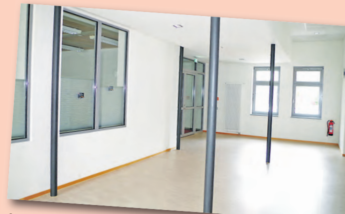
Selbst die Gänge bieten ein großzügiges Platzangebot.