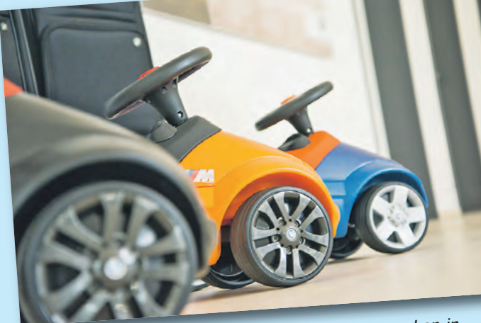
Mobilität fängt im neuen Autohaus Auer in Singen schon in ganz jungen Jahren an.

Das neue BMW-Zentrum der Auer-Gruppe in Singen an der Freibühlstraße ist Ergebnis einer sehr erfolgreichen Präsenz im regionalen Automarkt, die durch die Investition weiter gestärkt wurde.