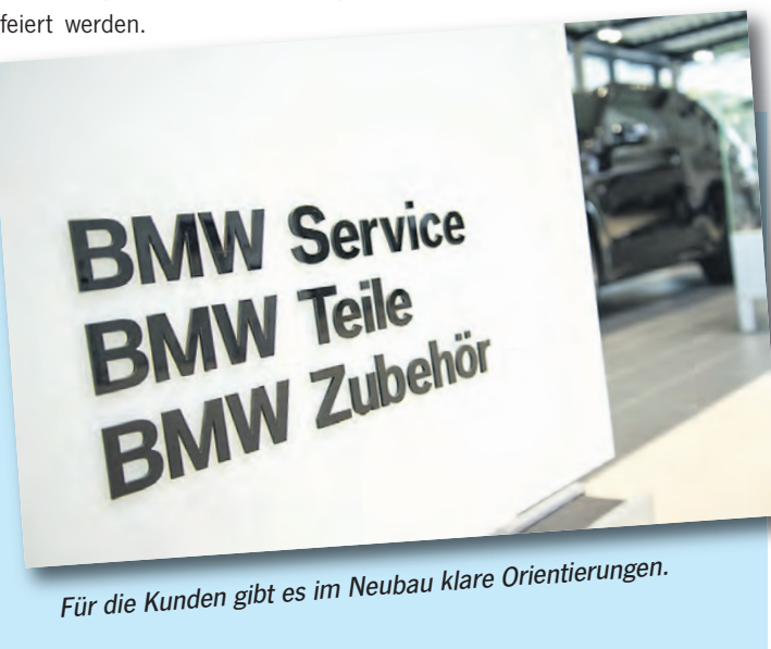
Für die Kunden gibt es im Neubau klare Orientierungen.

Deshalb ging es auf die Suche nach einem neuen Grundstück, das auch für die Zukunft entsprechende Flächen für weiteres Wachstum bietet.