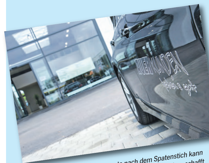
Es ist angerichtet. Nur zehn Monate nach dem Spatenstich kann das neue BMW-Autohaus in Singen eröffnet werden. Der Neubau schafft optimale Abläufe.

Mehr zum Unternehmen unter www.auer-gruppe.de