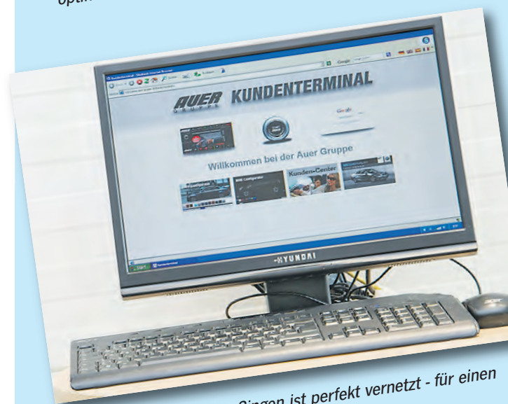
Das neue Autozentrum in Singen ist perfekt vernetzt - für einen optimalen Dienst am Kunden.