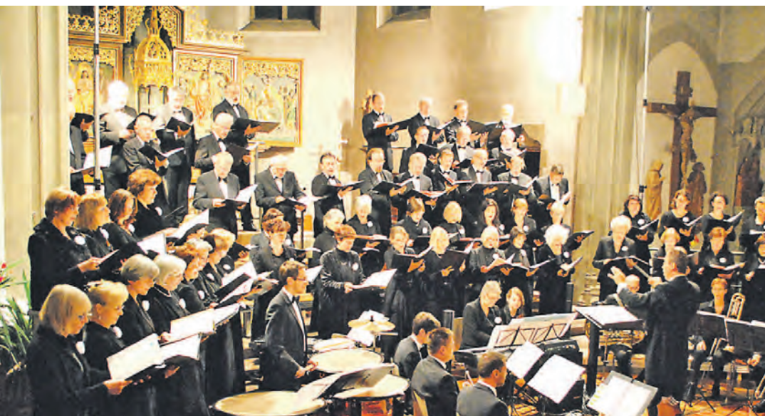
70 Sänger und Musiker bildeten das Ensemble beim Auftritt in Gailingen.