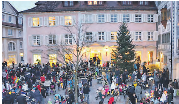
Am Donnerstag, 13. November lockt der bezaubernde Lichterabend in die Altstadt nach Engen.

Engen (swb). Am Donnerstag, 13. November ist es wieder soweit: Stadtverwaltung, Bewohner, Händler, Gewerbetreibende und Gastronomen laden dann von 17 bis 20 Uhr zum traditionellen Lichterabend in die idyllische Engener Altstadt ein. Auch die angrenzende Breitestraße wird stimmungsvoll beleuchtet. Bereits seit vierzehn Jahren wird die Altstadt am Donnerstag nach dem Martinsfest von Kerzen und anderen Lichtobjekten erhellt. So soll der Wunsch nach Frieden und freundschaftlichem Zusammenleben der Menschen in der Welt zum Ausdruck gebracht werden. Die Einzelhandelsgeschäfte werden an diesem Abend bis 20 Uhr geöffnet haben und ihre Kunden mit Snacks, Gebäck, Glühwein oder Punsch überraschen. Auch die Kindergarten- und Grundschulkinder können aktiv am Lichterabend teilnehmen. Der traditionelle Laternenumzug durch die autofreie Altstadt beginnt um 17 Uhr am Marktplatz und wird von der Musikschule Engen begleitet. Im Anschluss erhält jedes Kind mit Laterne eine süße Überraschung. Danach sind alle Kinder zum stimmungsvollen Puppenspiel des Waldorfindergartens »Das La-