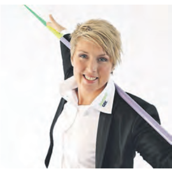
Weltmeisterin Christina Obergföll kommt zur Sportlerehrung nach Engen.