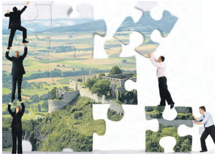
Premiere im WOCHENBLATT-Verlag: Mit dem druckfrischen »Unsere Wirtschaft - unsere Zukunft« ist das erste Magazin mit Rücken und Klebebindung erschienen.

Gedacht ist dieses moderne Magazin in erster Linie für junge, motivierte Menschen, die auf der Suche nach einem Ausbildungsplatz sind oder ihre Ausbildung gerade erfolgreich absolviert haben und nun im Berufsleben voll durchstarten möchten. Aber auch für gut ausgebildete Fach- und Führungskräfte, also die »Alteingesessenen«, wenn man so will, bietet »Unsere Wirtschaft - unsere Zukunft« einen kompakten Überblick über besonders attraktive Arbeitgeber quasi direkt vor der Haustüre. Und es gibt noch eine Premiere: Die Print-Ausgabe wird von einer eigenen facebook-Seite begleitet, auf der die Partner ebenfalls entdeckt werden können ( https://www.facebook.com/wochenblatt.jobbuch ). Ob fort-