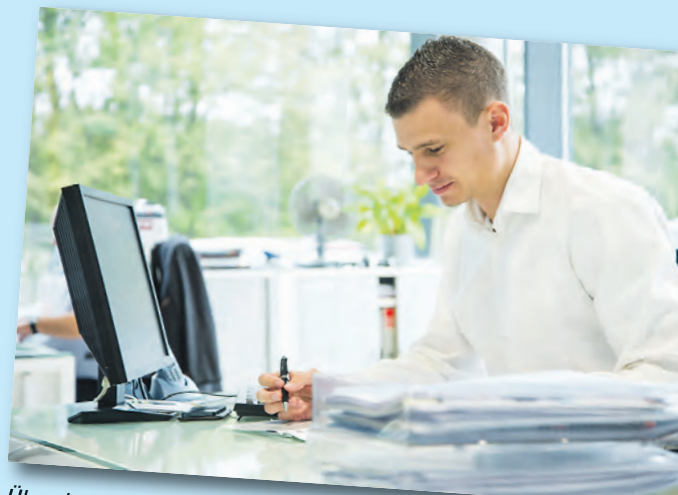
Über beste Anbindungen verfügt der Standort in Singen - aber auch über Ausblicke ins Grüne.