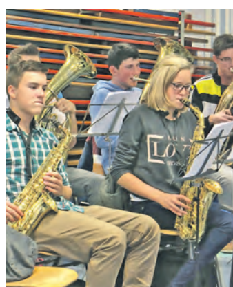
Sie proben fleißig für ihr Jahreskonzert am Samstag: die Musiker des MV Welschingen.

Welschingen (swb). In den Proberäumen des Musikvereins Welschingen geht es derzeit hoch her. Fast täglich treffen sich Aktive und Jungmusiker um sich auf das bevorstehende Konzert vorzubereiten. Es wird fleißig geübt, denn die Musiker wollen ihr Bestes geben, um den Besucher des Jahreskonzertes am Samstag, 8. November, 20 Uhr, in der Hohenhewenhalle in Welschingen eine tolle Vorstellung zu bieten. Ein abwechslungsreiches Programm mit Musikstücken aus den verschiedensten musikalischen Stilrichtungen soll dazu beitragen, die Gäste gut zu unterhalten. Auch der Konzertpartner, die Stadtmusik Engen, hat zu Zusatzproben aufgerufen und möchte mit einem vielfältigen Programm zum Gelingen des Abends beitragen. Die Dirigenten und die Aktiven der drei Orchester freuen sich auf das Doppelkonzert und hoffen auf einen regen Besuch.