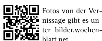
Fotos von der Vernissage gibt es unter bilder.wochenblatt.net .