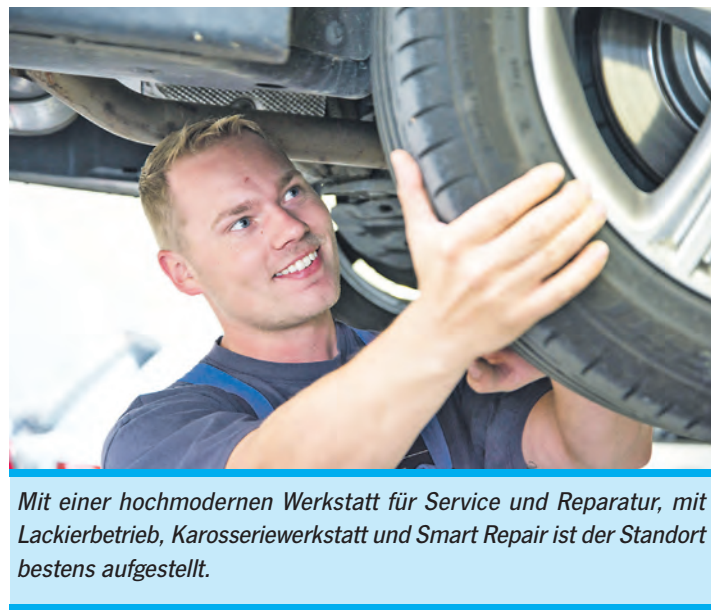
Mit einer hochmodernen Werkstatt für Service und Reparatur, mit Lackierbetrieb, Karosseriewerkstatt und Smart Repair ist der Standort bestens aufgestellt.

Runde mit deftigen Spezialitäten stärken. Dementsprechend werden den Besuchern hier Südtiroler Spezialitäten gereicht.