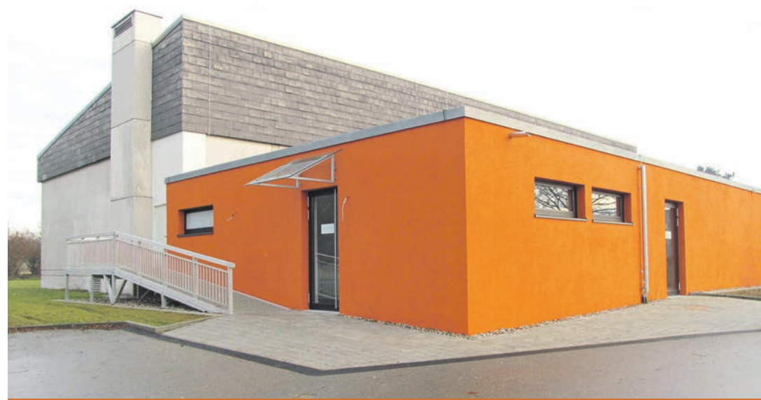
Der neue Anbau mit den modernen sanitären Anlagen erweitert die Hohenhewenhalle in Welschingen.

27. August 2012: Spatenstich Nutzfläche Bestand und Anbau: 1.008 m 2 , Umbauter Raum Bestand und Anbau: 5.900 m 3