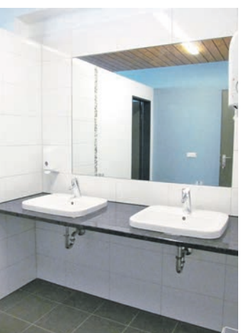
Die neuen Sanitärtrakte sind modern, freundlich und behindertengerecht.