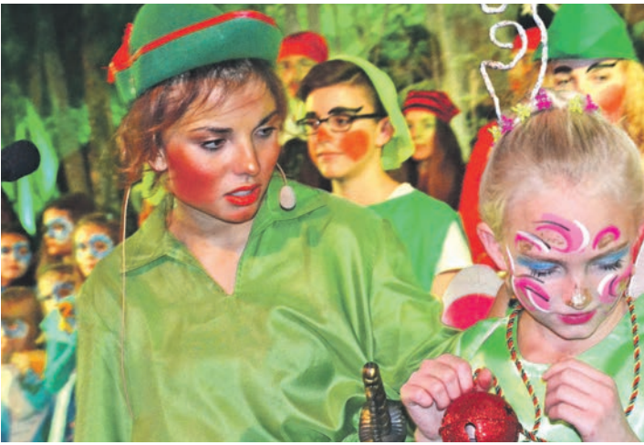
Peter Pan und Tinkerbell mit Glöckchen bei der Aufführung der Vocalinos im Foyer der Sparkasse.