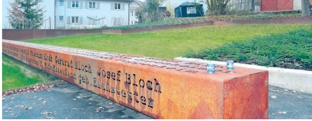
Statt abgeschottet mit Mauer: Die nun offene stahlumrandete Ebene zeichnet die Grundrisse der ehemaligen Randegger Synagoge nach und rückt den Platz ins öffentliche Bewusstsein.

Diesem Plan machte aber eine marode Mauer einen Strich durch die Rechnung. Im Nachhinein erwies sich dies jedoch als Glücksfall, eröffnete es den Planern doch ganz neue Möglichkeiten für die Gestaltung des Platzes in der Dorfmitte. Denn der zunächst angedachte massive, grellrote Betonfries auf der Mauer war umstritten. Nach dem Schock und der Wehmut über den Verlust dieser vielleicht letzten Reste der Synagoge wurde die Chance