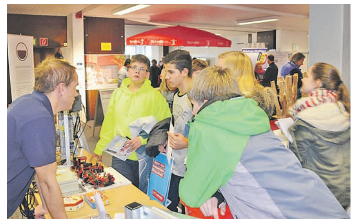
Gewinnbringende Gespräche gab es zwischen Schülern und Unternehmen bei der neunten Lehrstellenbörse an der Ten-Brink-Schule.

Rielasingen-Worblingen (swb). Am 15. und 16. November findet in der Festhalle der Talwiesenhallen die Lokalschau des Kaninchenzuchtvereins C 285 statt. Am Samstag in der Zeit von 14 Uhr bis 18 Uhr und am Sonntag von 10 Uhr bis 17 Uhr. Beim Frühschoppen spielen die »Original Aussteiger« aus Gottmadingen ab 11 Uhr. Nach wochenlangen Vorbereitungen werden die Züchter ihre schönsten Tiere präsentieren. Angeschlossen sind die Erzeugnisse der Frauengruppe. Für das leibliche Wohl der Gäste ist gesorgt, auch eine große Tombola wird es geben. Mehr Infos auf www.kaninchenzuchtverein-c285.de .