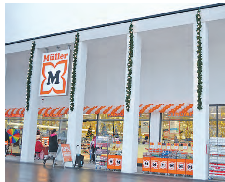
Freundlich, hell, hervorragend sortiert und einladend - so präsentiert sich die neue Müller-Filiale in Gottmadingen.