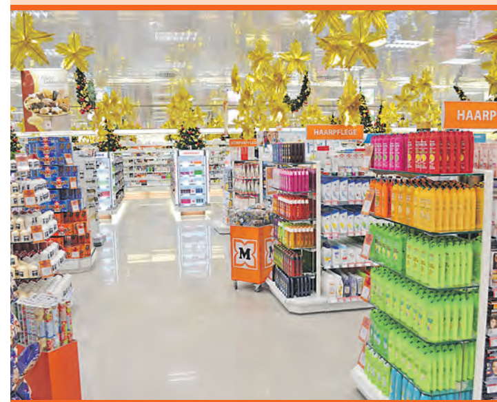
Die neue Filiale führt ein umfangreiches Sortiment aus Kosmetik, Süßwaren, Schreib-, Haushalts- und Spielwaren.