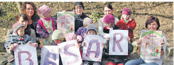
Eltern, Erzieherinnen und Kinder freuen sich auf den Adventsbasar.

te Spielsachen und Bücher werden angeboten. Es gibt wieder ein vielfältiges Programm für Kinder. Das Puppenspiel wird im benachbarten Impulshaus um 14.30 Uhr und um 15.30 Uhr aufgeführt. Für das leibliche Wohl wird bestens und liebevoll gesorgt.