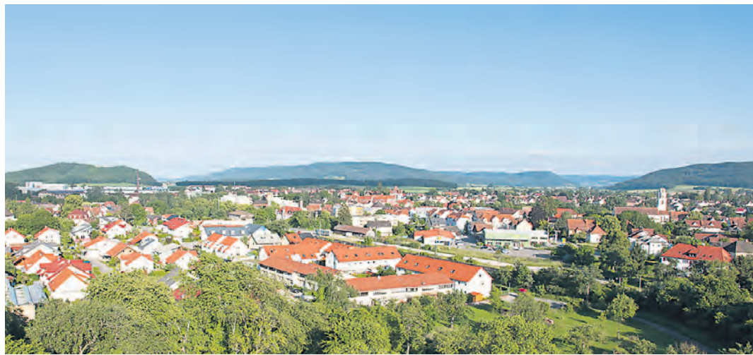
Gottmadingen hat sich mustergültig vom früher stark industrialisierten Dorf zu einer modernen und dienstleistungsstarken Gemeinde mit großem Angebot entwickelt.

Gottmadingen (sam). Nach dem Verkauf und der Schließung der letzten Brauerei im Ort sowie dem schrittweisen Niedergang der Traditionsfirma Fahr musste sich Gottmadingen in den letzten Jahrzehnten ganz neuen Herausforderungen stellen. Bürger und Verwaltung haben sich dem gestellt und den Balanceakt gemeistert: eine moderne Wohngemeinde mit hervorragender Nahversorgung zu werden und dazu ein breites Dienstleistungsangebot zu schaffen - aber dabei nicht die ursprünglichen, industriellen Wurzeln zu vergessen. In den letzten Jahren wurden die ehemaligen Fabrikflächen mit neuem Leben gefüllt. Die lange leerstehende Fahr-Kantine wurde mit viel Unterstützung der Gemeinde und dank beeindruckender Eigenleistungen der örtlichen Vereine in ein beliebtes Veranstaltungsgebäude umgewandelt. Neue Firmen haben sich in den traditionsreichen Gebäuden angesiedelt und das Gelände wird auch weiterhin durch die Investoren