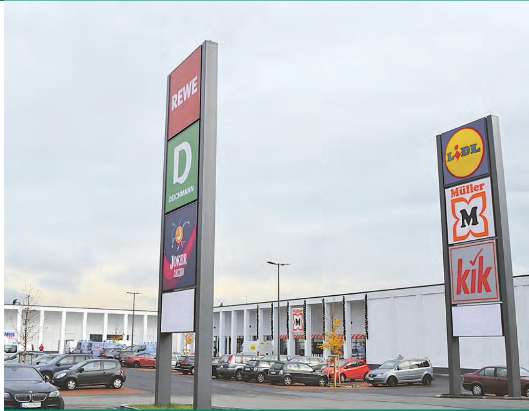
Das Einkaufszentrum bereichert mit seinen neuen Geschäften die Einkaufsvielfalt in Gottmadingen.

gesetzlicher Regelungen nicht möglich gewesen.