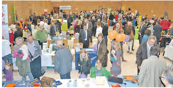
Ein buntes Bild bot sich den Besuchern der neunten Engener Tischnesse.

geschäfte und nahezu 100 Verkaufsstände mit einem mannigfaltigen Angebot machen das Bummeln zu einem ganz besonderen Erlebnis.