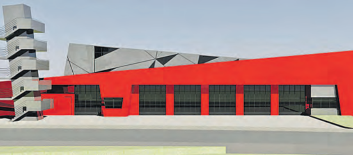
So könnte das neue Feuerwehrhaus in Hilzingen nach den Entwürfen von Architekt Andreas Wieser aussehen.

Deshalb soll Architekt Andreas Wieser neben einer Reduzierung des Raumprogrammes auch die Architektur kritisch unter die Lupe nehmen, um die Kosten zu senken.