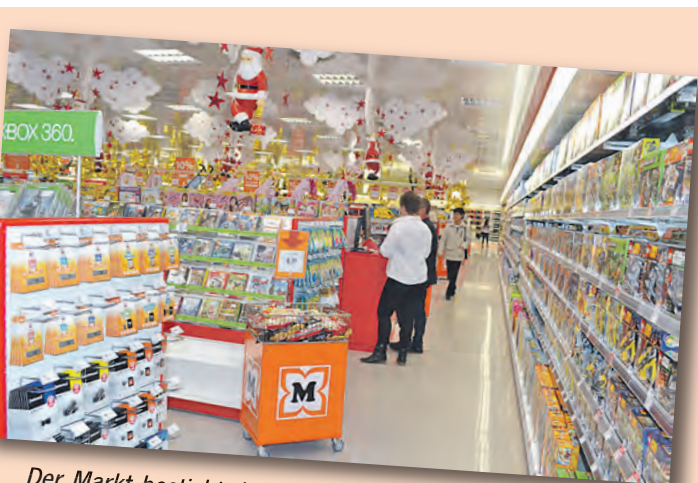
Der Markt besticht durch eine große Auswahl an Multimedia-Artikeln und Spielwaren.

Die neue Müller-Filiale im FMZ Stegleacker hat Montag bis Freitag von 08.00 bis 20.00 Uhr und am Samstag von 8.00 bis 18.00 Uhr für Sie geöffnet.