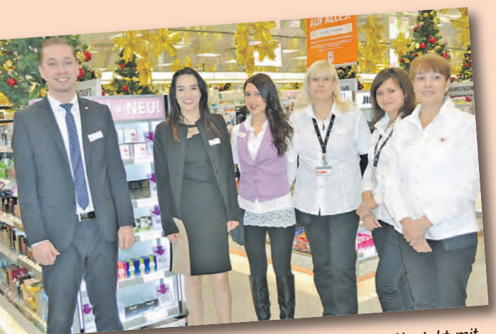
Die freundlichen Mitarbeiter freuen sich auf den Kontakt mit vielen Kunden.