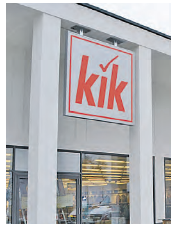
Auch der Textildiscounter Kik eröffnet neu im Fachmarktzentrum »Stegleacker«.

Die KiK-Filialen bekommen in den nächsten Jahren ein neues Gesicht – Ziel ist es, das gesamte Filialnetz im In- und Ausland bis 2017 nach den Kriterien des neuen Konzeptes in Silber erstrahlen zu lassen. Mit der Umgestaltung der KiK-Filialen möchte KiK seinen Kunden ein freundlicheres und strukturierteres Einkaufserlebnis ermöglichen. Dabei wird das umfangreiche Sortiment noch ansprechender präsentiert sowie für Kunden und Mitarbeiter in den KiK-Filialen eine echte Wohlfühl-Atmosphäre ge-