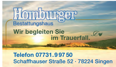
Telefon 07731.997 50 Schaffhauser Straße 52 · 78224 Singen

Engen (swb). In die Zielgerade biegen die Vorbereitungen für den 22. Engener Weihnachtsmarkt ein. Er findet am 29. und 30. November statt. Die Besucher sind am Samstag von 11 bis 21 Uhr