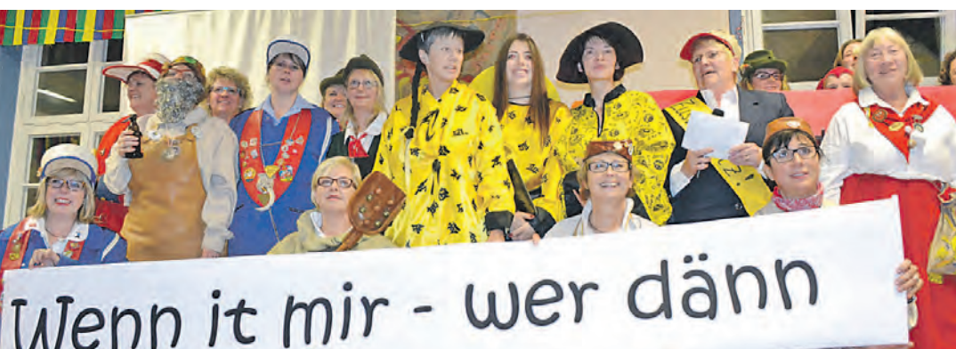
Die Gottmadinger Gerstensäcke präsentierten am 11.11. ihr Fasnetmotto: »Wenn it mir wer dänn?«.