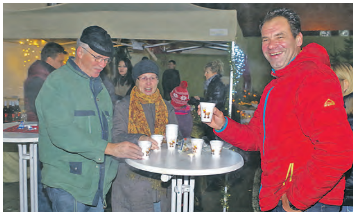
Beste Stimmung herrschte auf dem Arleiner Adventsmarkt am neuen Standort.