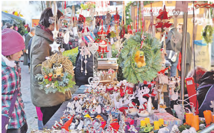
Mit Kerzen, Tannengrün, Misteln, Gebäck, Deko, Geschenken, Glühwein und vielem mehr laden zahlreiche Weihnachtsmärkte am Wochenende die Besucher zum Bummeln ein.

Hegau (sam). Alle Jahre wieder öffnen pünktlich zum Advent allüberall im Hegau die Weihnachtsmärkte ihre Pforten. Premiere feiert am Freitag, 28. November, ab 11 Uhr der erste »Singerer Hüttenzauber« auf dem Rathausplatz. Auch Tengen lädt am 28. November von 14 bis 19.30 Uhr rund ums historische Stadttor zum Bummel über den beschaulichen Nikolausmarkt ein. In der Gailinger Hochrheinhalle können sich die Besucher beim dritten weihnachtlichen Kreativmarkt am 29. November vom besonderen adventlichen Angebot bezaubern lassen. Mehr als 60 Hobbykünstler aus der Region bieten hier von 10 bis 18 Uhr ihre kunst- und liebevoll selbst gefertigten Produkte an. Das außergewöhnliche Angebot reicht von weihnachtlichen Dekorationen und Holzkrippen, über Gebäck, Strickwaren und Basteleien, Schmuck, Steine oder Mineralien bis hin zu einer großen Auswahl an Adventskränzen.