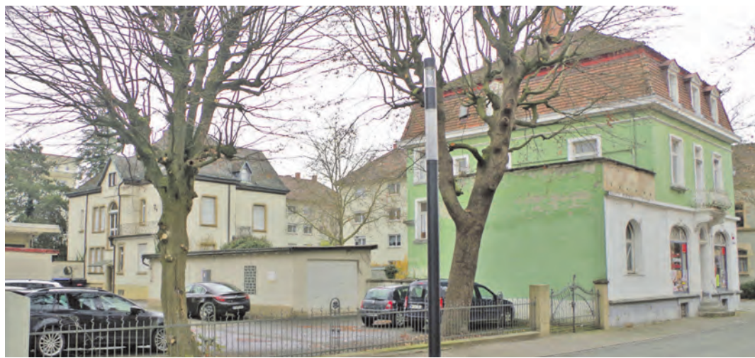
So wechselvoll kann ein Jahr sein. Das an die Stadt Singen vererbte Areal der Wetzstein-Villa in der Singener Innenstadt sollte eigentlich zur Öko-Siedlung für junge Familien umgestaltet werden. Der Plan scheiterte nach dem Realisierungswettbewerb mangels Bauträger. Zwischenzeitlich sollte dort das Projekt »Time out School« des Vereins »Menschen helfen« unterkommen, was durch einen Wasserschaden verhindert wurde. Jetzt bietet die Stadt Singen das Areal einer ökumenischen Interessensgemeinschaft zum Bau eines stationären Hospiz an. Ganz am Anfang der Planungen sollte die Villa (links hinten) übrigens mal Quartier-, Senioren- oder Familienzentrums werden. Das »Grüne Haus«