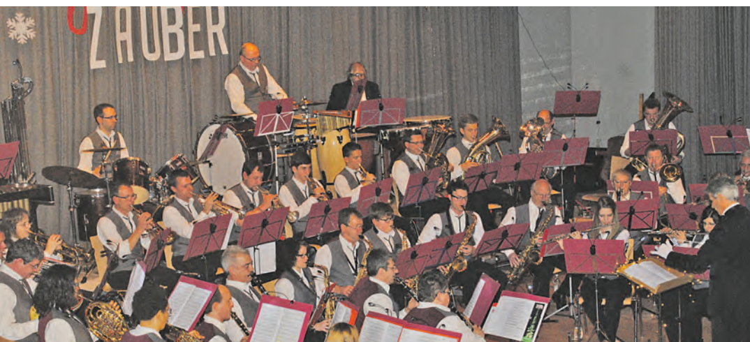
Der Musikverein Gailingen und die Jugendspielgruppe Gailingen und Ramsen präsentierten mit ihrem Jahreskonzert einen »Winterzauber« auf sehr hohem Niveau.