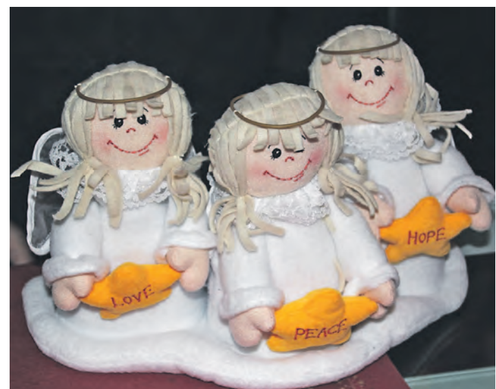
Das WOCHENBLATT bedankt sich bei allen, die während der Weihnachtszeit an uns gedacht haben, und wünscht allen Lesern, Freunden und Kunden ein gesundes und erfolgreiches Jahr 2014.

Radolfzell/Stockach (sw). So machte der tägliche Gang zum Briefkasten Freude: In den letzten Wochen erhielt das WOCHENBLATT viele, viele Weihnachts- und Neujahrskarten mit aufbauenden Zitaten, lebensklugen Sprüchen und wunderschönen Bildmotiven. Verkauf und Redaktion möchten sich ganz herzlich bei allen Adressaten bedanken, die zum Jahresende an uns gedacht und uns mit ihren Grüßen und guten Wünschen erfreut haben.