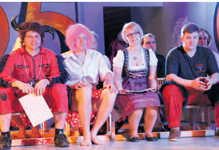
Einen vergnüglichen Bunten Abend zu ihrem 25-jährigen Bestehen boten die »Schimmelreiter« Güttingen. Ein Höhepunkt war die Nummer »schimmelige Fashionnight«.