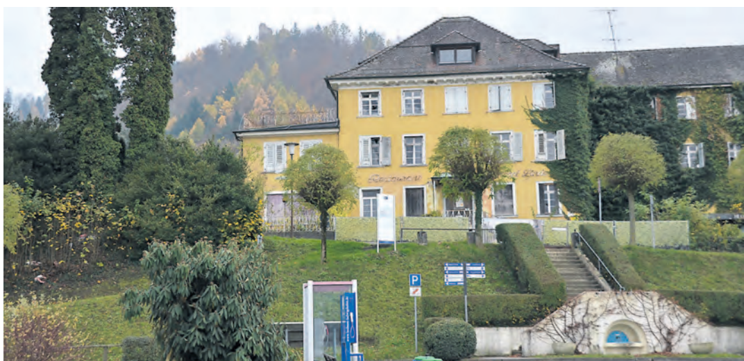
Die Zukunft der »Linde« in Bodman ist ein Dauerbrenner im Gemeinderat der Seegemeinde.