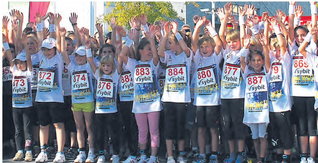
Ein Ereignis für Jung und Alt: Der Bodensee-Firmenlauf wird in diesem Jahr eine Pause einlegen. Leider deckte das beliebte Lauf-Event nicht alle Kosten ab.