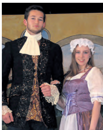
Am 9. und 11. April zeigt die Theater-AG der Evangelischen Schule Schloss Gaienhofen das Stück »Viel Lärm um nichts«.

Iznang (swb). Die diesjährige Jahreshauptversammlung des TuS Iznang findet am Samstag, 5. April, um 20 Uhr im Sportheim »Mooswald« statt. Eingeladen sind alle Mitglieder und Freunde des TuS Iznang. Auf der Tagesordnung am Samstag stehen neben diversen Berichten unter anderem auch Neuwahlen und Ehrungen verdienter Mitglieder.