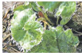
Das neue Programm des UmweltZentrum Stockach hat diverse Veranstaltungen zu bieten.