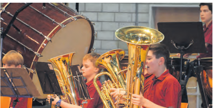
Musikalische Perlen gibt es beim Frühjahrskonzert der Jugendmusikschule zu hören.

Stockach (swb). Da rollen wieder die Würfel! Am Mittwoch, 9. April, organisieren die Malteser wieder einen Spielesonntag in ihrer Geschäftsstelle in der Kaufhausstraße 46. Ab 15 Uhr gibt es gesellige Runden, Kaffee, Kuchen und einen fröhlichen Nachmittag mit Gleichgesinnten. Ein Fahrdienst steht nach vorheriger Anmeldung unter Telefon 07771/87 75 03 zur Verfügung. Die Malteser freuen sich auch über ehrenamtliche Mitarbeiter, die gerne ein, zwei Stunden in der Woche für ihre Mitmenschen aufbringen. Infos unter 07771/87 75 03 oder www.malteser-stockach.de .