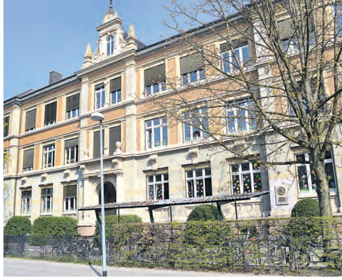
Könnte frühestens im Schuljahr 2016/17 eine Gemeinschaftsschule werden: die Teggingerschule in Radolfzell.