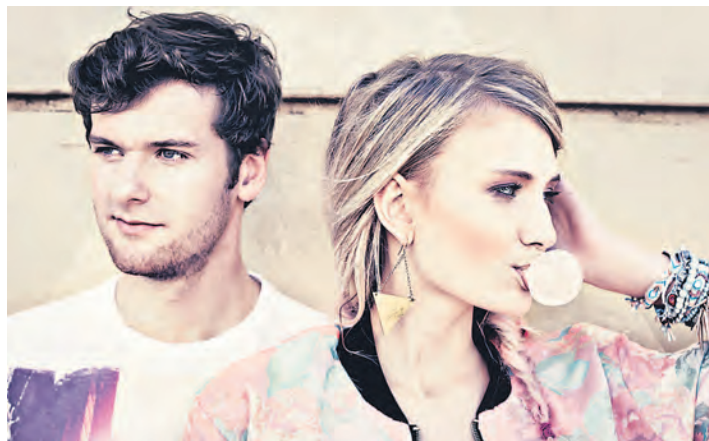
Erstmals beim Schweizer Feiertag mit dabei - Glasperlenspiel.