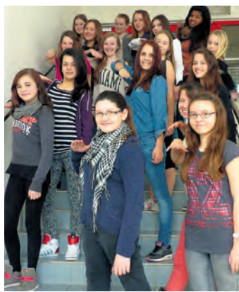
Die Schülergruppe des Tanztheaterprojektes der Realschule Stockach hoffen auf viele Besucher bei der Premiere von »Ich 2.0«.