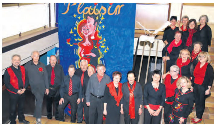
Unter dem Motto »Plaisir d'Amour« präsentiert sich der Eintracht-Chor unter neuer Leitung.