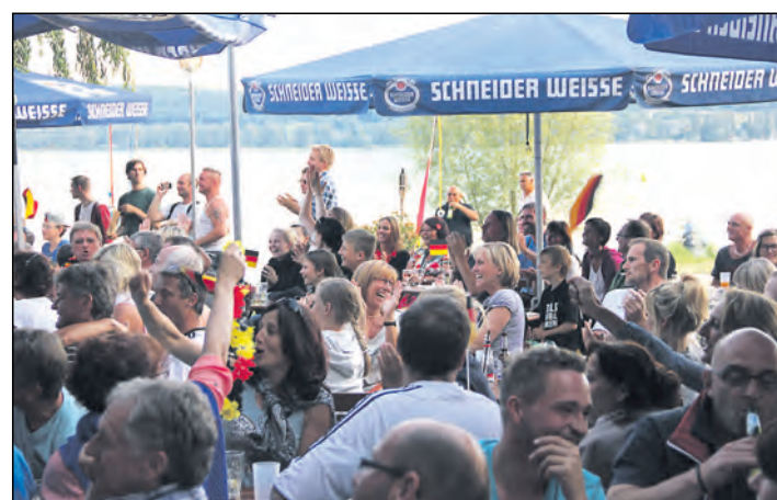
Das war ein Auftakt nach Maß: Die deutsche Nationalmannschaft ließ den Portugiesen bei ihrem ersten Auftritt nicht den Hauch einer Chance und fetzte die Elf um Weltfußballer Cristiano Ronaldo mit 4:0 vom Platz. Danach kannte der Jubel in und um Radolfzell keine Grenzen. Zahlreiche Fußballfans verfolgten das WM-Spiel beim Public Viewing. Egal ob im Milchwerk oder wie hier am Radolfzeller Seeufer – zahlreiche Fußballfans nutzen die Gunst der Stunde, um mit Gleichgesinnten gemeinsam zu feiern.

Mutter etwa wegen Krankheit oder eines Kuraufenthalts länger ausfällt. »Im Landkreis Konstanz gibt es zur Entlastung der Eltern auch das Ehrenamtsprojekt »welcome«, welches