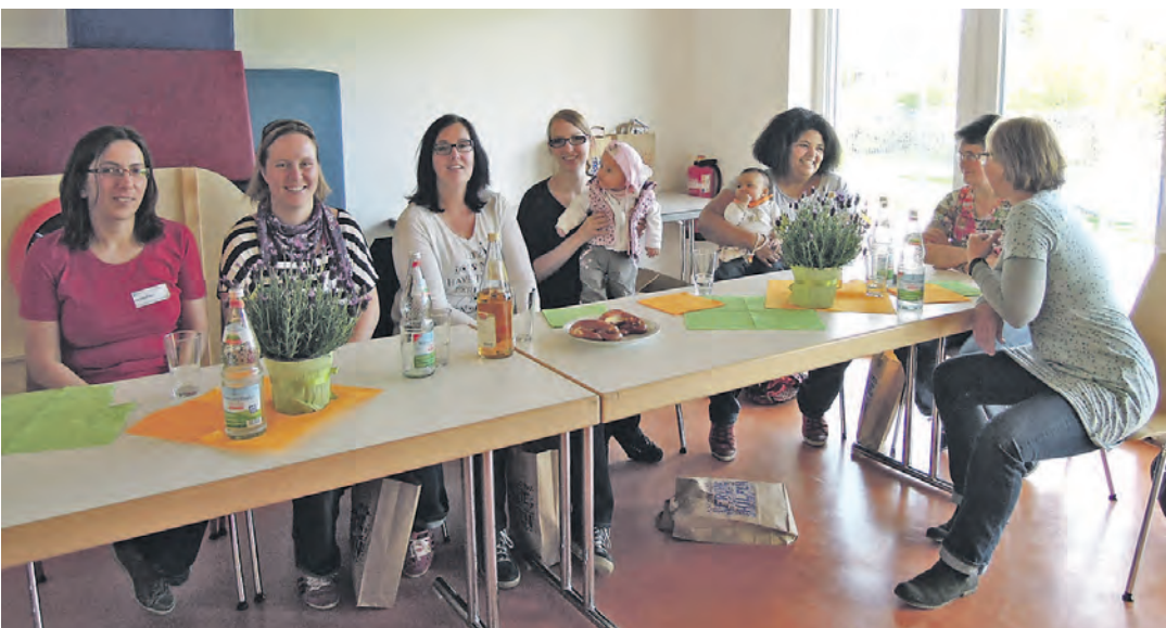
In Mühlingen wurden Neugeborene mit ihren Angehörigen im Rahmen einer Begrüßungsveranstaltung ganz herzlich willkommen geheißen.

Ein kleines Begrüßungsgeschenk gab es auch: Die jungen Familien erhielten ein Präsent der Gemeinde Mühlingen und eine Tüte voller Informationsmaterial vom Fachdienst Frühe Hilfen.