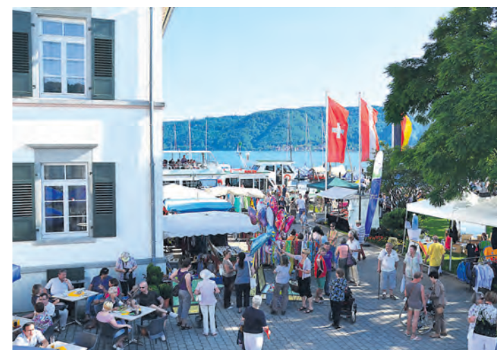
Beim »Hafenfest« in Ludwigshafen schlägt die Stimmung hohe Wellen.

21 Uhr: Fußballfans müssen auf ihr Vergnügen nicht verzichten. Das Weltmeisterschaftsspiel Deutschland gegen Ghana wird