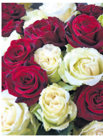
Blumige Freuden lassen Besucher aufblühen.