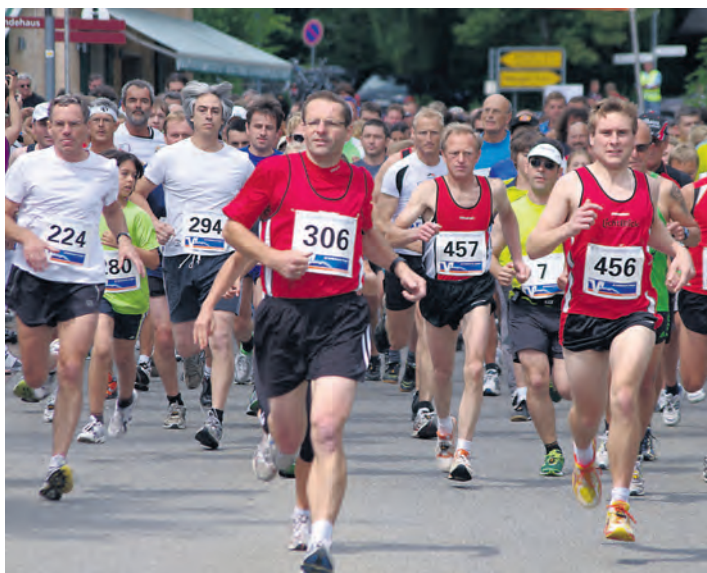
Schienen wird zum Läufer-Mekka: Auch in diesem Jahr hoffen die Veranstalter des Schienerberglaufes auf zahlreiche Anmeldungen.