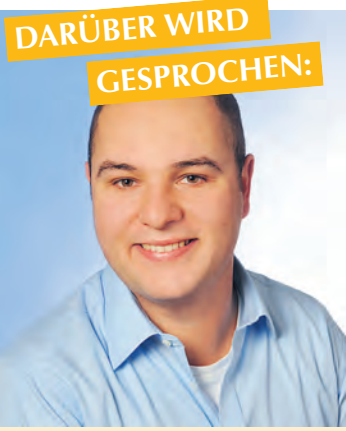
DARÜBER WIRD GESPROCHEN:

18. JUNI 2014 WOCHE 25 RA/AUFLAGE 20.706 GESAMTAUFLAGE 86.506 SCHUTZGEBÜHR 1,20 €