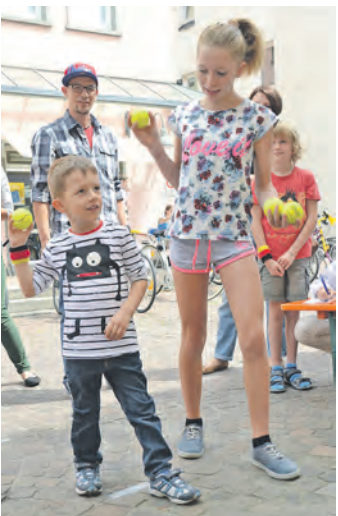
Strahlende Kinderaugen und entspannte Eltern: »Herz für Kinder« war abermals ein voller Erfolg.