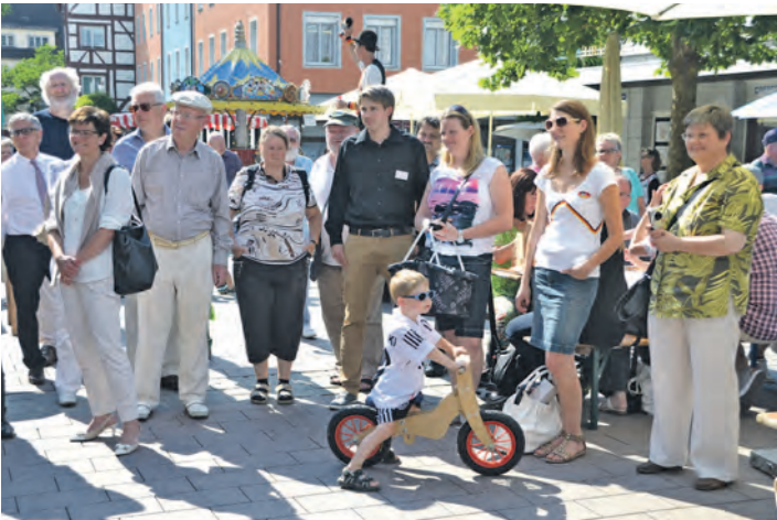
Verweilen auf dem Markt nach Feierabend: Bereits zur Eröffnung der Radolfzeller Abendmärkte pilgerten zahlreiche Radolfzeller auf den Marktplatz.

pe in den Räumlichkeiten der Firma »dekora« anschließen oder dort die selbst genähten Figuren bis zum 31. Juli abgeben. »Die Kuscheltiere werden wir Anfang August der Radolfzeller Tafel übergeben, denn die Figuren sollen den hilfsbedürftigen Kindern zu Gute kommen, die nichts für die finanziell schwierige Situation ihrer Eltern können«, so Horber. Bis zum heutigen Tage haben die Damen 23 verschiedene Figuren und Tücher hergestellt.