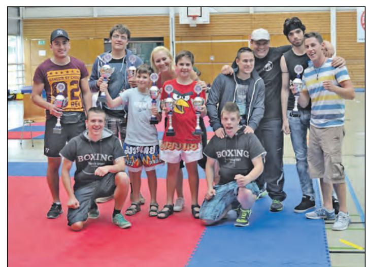
Neue Meister beim Fight-Club Radolfzell: Bei der Süddeutschen Meisterschaft der WFMC (World Fight Sport & Martial Arts Council), welche in Schwenningen ausgetragen wurde, konnten sich die Wettkämpfer des Fight-Club Radolfzell erneut gegen starke Konkurrenz behaupten und gleich viermal ganz oben auf dem Siebertreppchen landen. Gleich acht Kampfsportler kämpften sich in die Finale, aus welchen vier süddeutsche Meister und vier Vize-Süddeutsche-Meister hervorgingen.

Radolfzell (swb). Sicherheit und Qualität sind wichtige Voraussetzungen einer erfolgreichen medizinischen Behandlung. Die Baden-Württembergische Krankenhausgesellschaft unterstreicht dies mit der vom 7. bis 11. Juli stattfindenden landesweiten Themenwoche »Patientensicherheit und Qualität in den baden-württembergischen Kliniken«. Die Themenwoche steht unter der Schirmherrschaft von Ministerpräsident Winfried Kretschmann. Auch die medizinischen Reha-Einrichtungen der Stadt Radolfzell auf der Mettnau informieren im Rahmen einer Vortragsveranstaltung am 10. Juli über die verschiedenen Aspekte der Behandlungsqualität, Qualitätskontrolle und Patientensicherheit. Chefarzt Dr. Robin Schulze wird anhand praktischer Beispiele Einblicke geben, wie die Behandlungsqualität und Patientensicherheit in den Kliniken der Mettnau intern und extern engmaschig kontrolliert und bewertet wird. Dabei wird auch die im Rahmen der QS-Verfahren erhobene Struktur-, Prozess- und Ergebnisqualität sowie die Patientenzufriedenheit im bundesweiten Vergleich mit anderen Kliniken dargestellt. Veranstaltungsbeginn ist um 19 Uhr in der Werner-Messmer-Klinik, EG, Raum Mainau, Strandbadstraße 80.