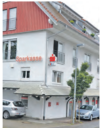
Bis zum 1. Oktober wird die Sparkasse Singen-Radolfzell ihre Filialen in Markelfingen, Liggeringen und Stahringen schließen.