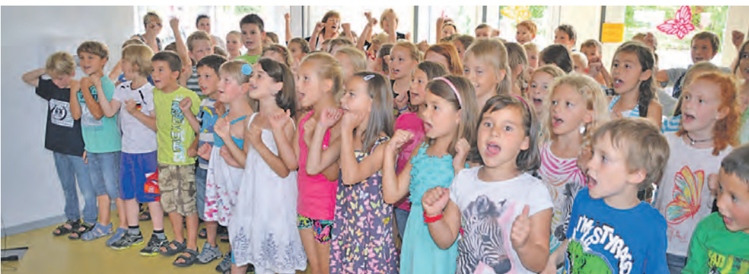
»Hip-Hop unsere Schule ist top«, freuten sich die Kinder über die neuen Erweiterungsanbauten an Schule und Kindergarten in Nenzingen.