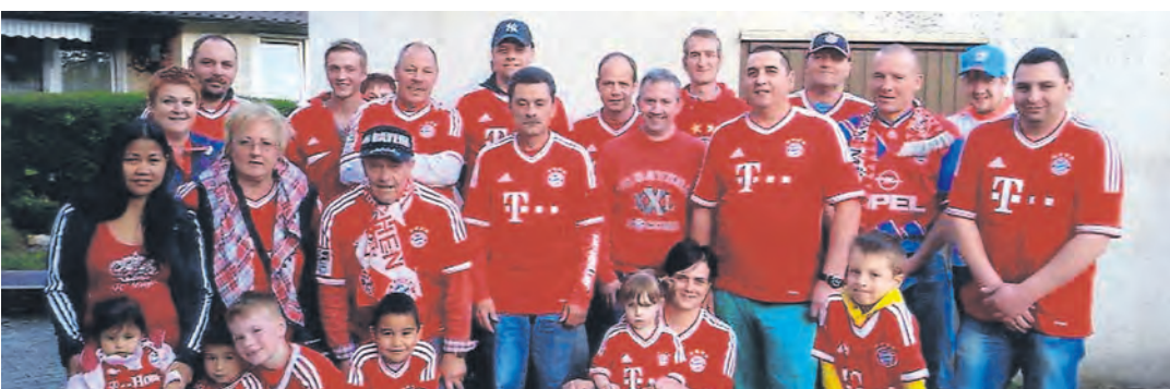
Volltreffer: Stockachs Bayernfans engagieren sich für den guten Zweck.

Mehr Fotos zu dem Festakt stehen unter bilder.wochenblatt.net