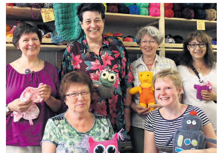
Die engagierten Handarbeitsdamen mit einigen ihrer selbst entworfenen Figuren, die den Kindern der Radolfzeller Tafel gespendet werden sollen.