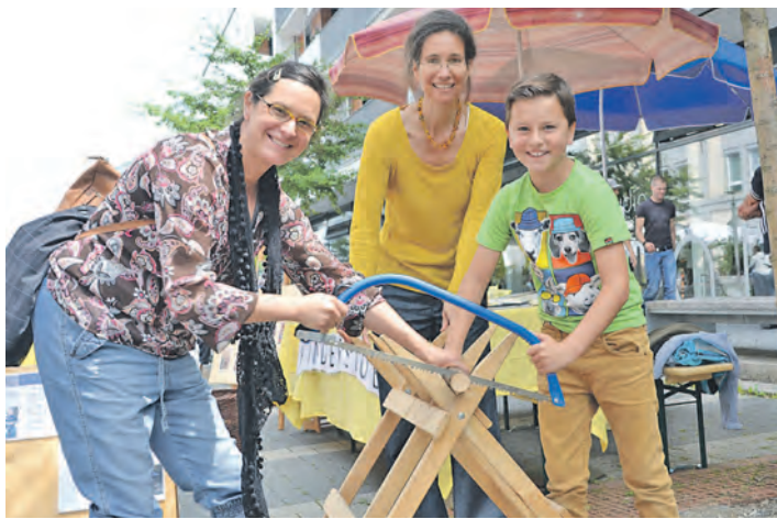
Zu entdecken gab es am vergangenen Samstag beim Aktionssamstag »Herz für Kinder« so einiges: Egal, ob Wettsägen, Kinder-Rallye oder Geschicklichkeits-Parcours, an jeder Ecke gab es etwas zu erleben.

Radolfzell (gü). Radolfzell und seine Kinder: eine Kombination, die sich beim Aktionssamstag »Herz für Kinder« wieder von ihrer besten Seite gezeigt hat. Egal, wohin man am vergangenen Samstag schaute oder horchte, überall vernahm man strahlende Kinderaugen und zufriedenes Kinderlachen. Auch bei der Radolfzeller Aktionsgemeinschaft und dem Familienverband, die den Aktionssamstag traditionell gemeinsam organisieren, fiel das Fazit positiv aus. »Wir sind mit der Resonanz sehr zufrieden. Gerade für Vereine und Organisationen, die an »Herz für Kinder« teilnahmen, boten sich die besten Möglichkeiten, sich direkt bei den Eltern, aber auch