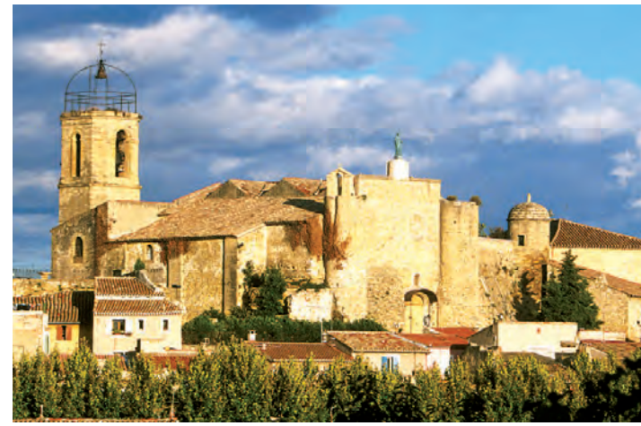
Die Sonderausstellung über die Radolfzeller Partnerstadt Istres ist noch bis zum 2. November im Stadtmuseum zu bewundern.