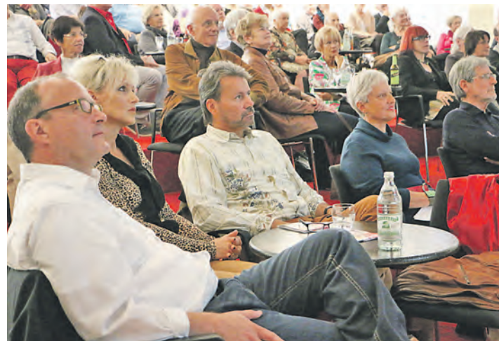
Zahlreiche Bürgerinnen und Bürger interessierten sich am Sonntag für die ersten Ergebnisse und die weiteren Schritte zum Radolfzeller Kulturleitbild.

nale vielfältige Kunst, Kultur und Bildung fördern und unterstützen sowie das kulturelle Erbe und die gelebten Traditionen wie das Hausherrnfest pflegen. Weiterhin soll ein lebenslanges Lernen durch ein individuelles Bildungsangebot ermöglicht sowie eine Plattformen für lebendige Kooperationen geboten werden und man will offen für Neues sein. Darüber hinaus soll »KULTUR Radolfzell« durch ein kreatives, innovatives und zielgruppenorientiertes Kulturprogramm begeistern. Schließlich sieht die letzte Leitlinie nachhaltige und umweltfreundliche Kultur- und Veranstaltungskonzepte vor. In der abschließenden Fragerunde