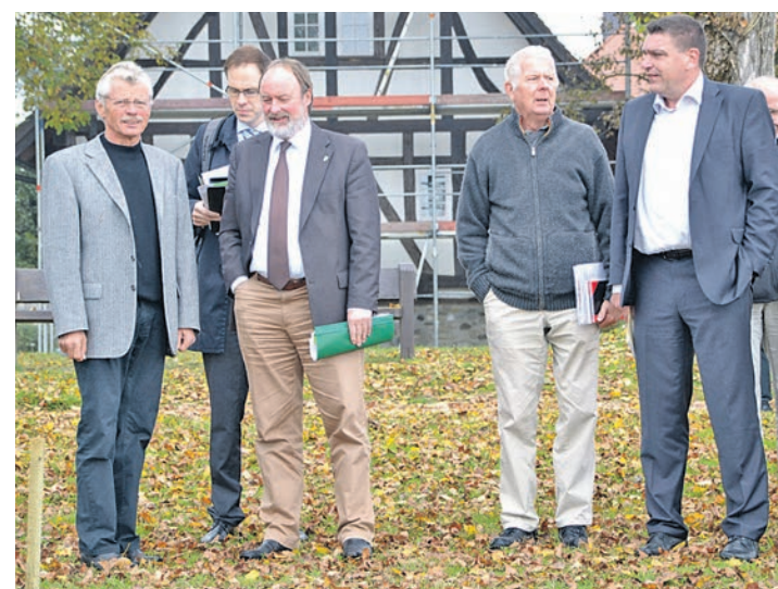
Nach langer Diskussion einigten sich die Verantwortlichen des Fördervereins Fischerhaus und des Landratsamtes auf einen Kompromiss: Das geplante Pfahlbauhaus soll nun rund vier Meter dichter an die ehemalige Uferzone zu rücken.

Bereits im September 2013 hatten sowohl das Landratsamt Konstanz als auch das Umweltministerium Baden-Württemberg die Errichtung eines Pfahlbauhauses im Flachwasser vor Öhningen-Wangen abgelehnt. Als Grund hierfür nannten die Verantwortlichen des Amtes für Baurecht und Umwelt, dass der Bereich vor einigen Jahren renaturiert wurde. »Dieser renaturierte Bereich muss geschützt werden«, erklärte Thomas Buser, Amtsleiter für Baurecht und Umwelt beim Landratsamt. Eine Aussage, die beim Förderverein des Fischerhauses und bei der Gemeinde Öhningen für Unverständnis sorgte. »Wir hoffen auf eine Ermessensentscheidung des Landratsamtes. Hier in Wangen existiert ein Bedürfnis unser Weltkulturerbe für die Öffent-