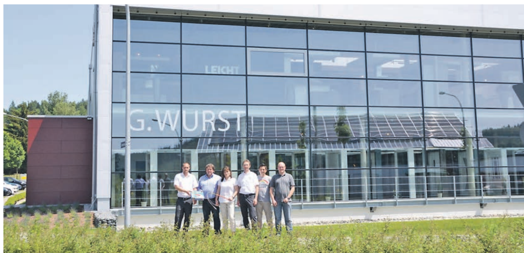
Das schnelle Internet DSL wurde auch im Gewerbegebiet »Blumhof« ausgebaut: Als erstes Unternehmen dort hatte »G. Wurst Fensterbau« im Juni 2013 einen DSL-Anschluss erhalten.

Stockach (swb). Bei der Hänselegruppe aus Stockach stehen einige Termine an. Für das Aufhängen der Weihnachtsbeleuchtung am Freitag, 14. November, um 18 Uhr, am Samstag, 15. November, um 12 Uhr, Freitag, 21. November, um 18 Uhr sowie Samstag, 22. November, um 12 Uhr wurde die Grund- und Werkrealschule Stockach als Treffpunkt festgelegt. Die nächsten Hästauschtafe finden am Freitag, 14. November, von 18 bis 20 Uhr und Freitag, 21. November, von 18 bis 20 Uhr im Hans-Kuony-Haus in der Höllstraße statt.