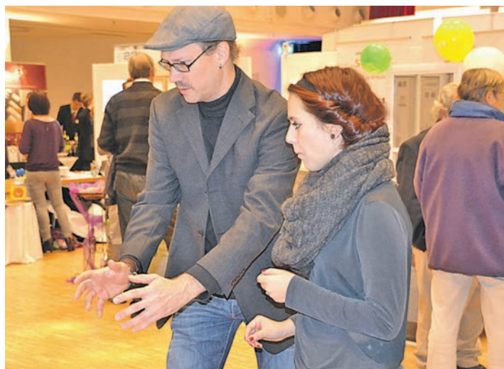
Networking war angesagt beim ersten Biznesstreff im Milchwerk in Radolfzell. An unterschiedlichen Ständen nutzten zahlreiche Firmen und Besucher die Möglichkeit sich untereinander auszutauschen und ins Gespräch zu kommen.

sentierte der MV eine musikalische Bandbreite und eine interessante Mischung aus verschiedenen Facetten der Blasmusik. Aber auch Blasmusik wie Walzer, Marsch und Polka stehen auf dem Programm.