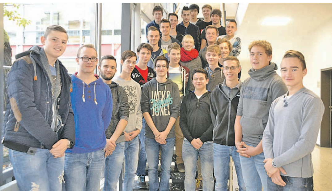
Engagierte Schüler des Stockacher Berufsschulzentrums bieten Kurse zu EDV, Smartphones, iPads, Tablets oder Skype im Schulgebäude in der Conradin-Kreutzer-Straße an.