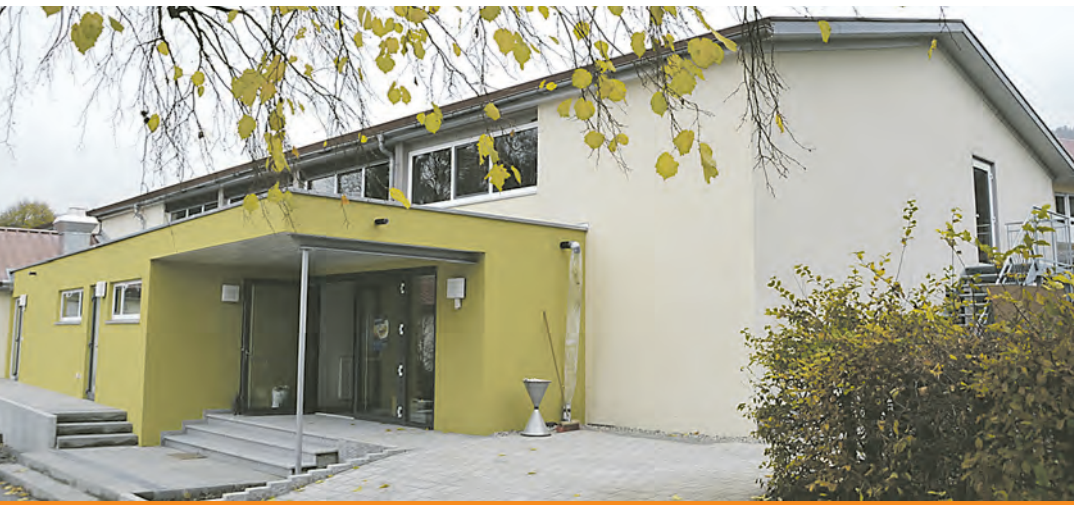
Das katholische Gemeindezentrum in Ludwigshafen wurde baulich erneuert, modernisiert und umgestaltet.