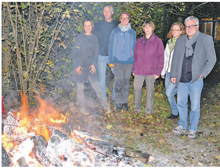
Ein letztes Mal Lagerfeueratmosphäre: Das Nabu-Zentrum auf der Mettnau wird geschlossen. Darüber informierten die Nabu-Verantwortlichen jüngst die Presse.