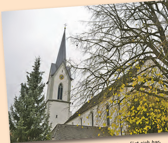
Das neu gestaltete katholische Gemeindezentrum fügt sich harmonisch in die Umgebung auch mit der Kirche ein.