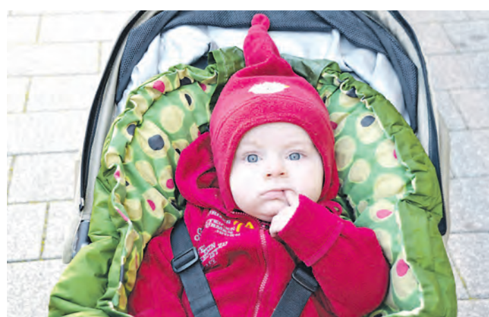
»Hm. Mag ich den verkaufsoffenen Sonntag nun oder nicht«. Theresa konnte sich nicht entscheiden, doch viele, viele Kunden genossen das Shopping-Vergnügen in vollen Zügen.