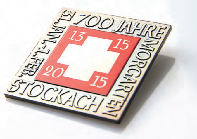
Ein hochwertiges Festabzeichen kann ab Dreikönig für die Jubiläumsfeierlichkeiten am Samstag, 31. Januar, und Sonntag, 1. Februar, erworben werden.