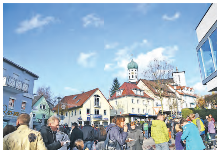
Der »klassische« verkaufsoffene Sonntag mit Konzentration auf die Geschäfte, den der Verein Handel, Handwerk und Gewerbe Stockach (HHG) versprochen hatte, lockte zahlreiche Besucher an.