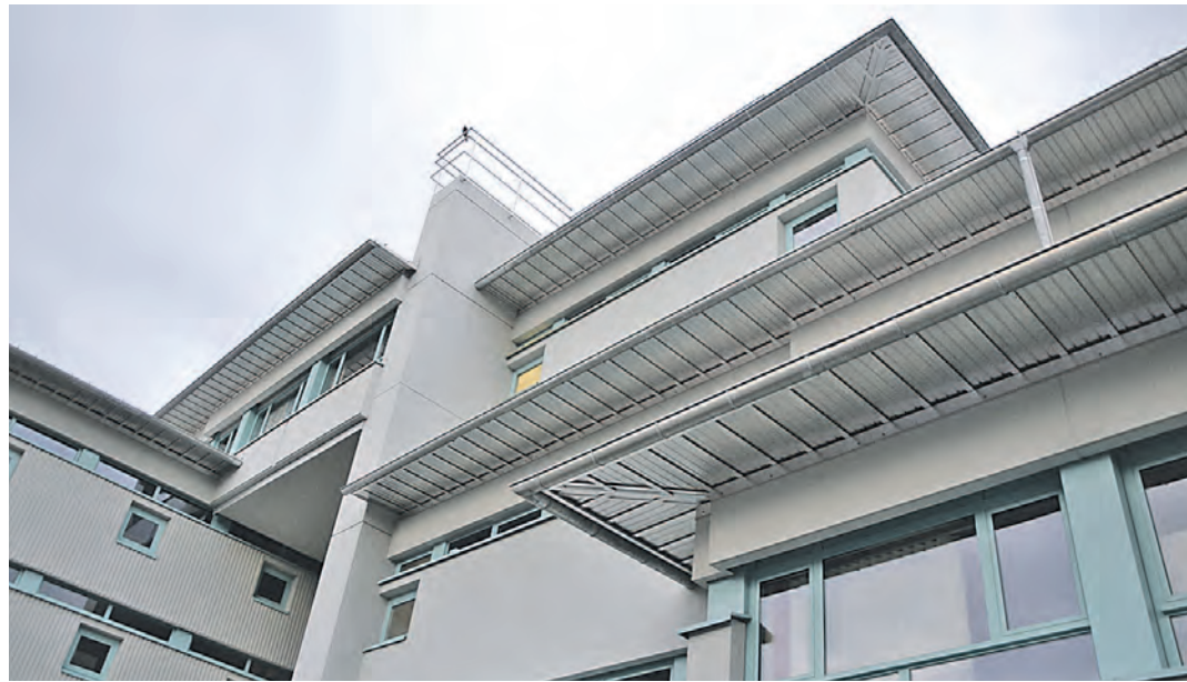
Im Stockacher Rathaus soll es künftig weniger Termine für Wochenendtrauungen geben.