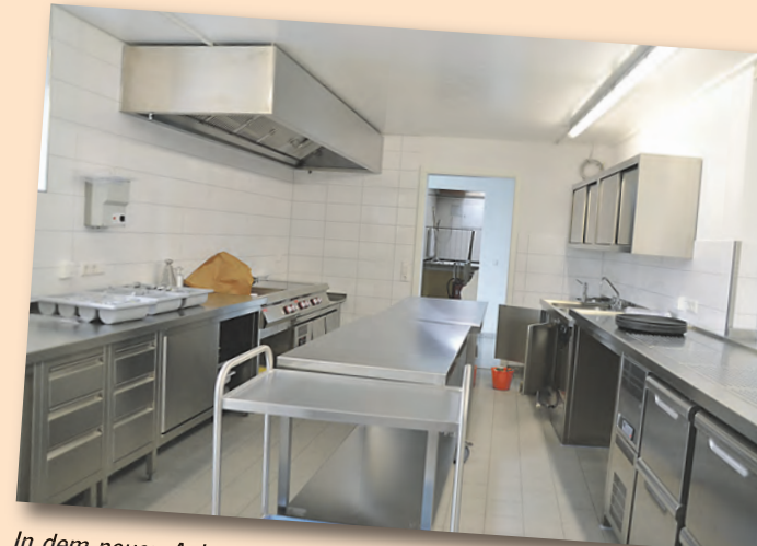
In dem neuen Anbau an der Südseite wurde eine moderne Küche eingebaut.

Dadurch ist das Gebäude nun noch nutzerfreundlicher geworden. Denn das Ludwigshafener Zentrum soll für vielfältige Veranstaltungen wie Konzerte, Theateraufführungen, Vorträge oder Fastnachtsveranstaltungen genutzt werden. Die Kirchengemeinde hat das Gebäude für 20 Jahre zu einem symbolischen Preis an die politische Gemeinde vermietet, die sich dafür um Baumaßnahmen und Unterhalt kümmert. Genutzt werden kann das Zentrum von beiden - politischer und kirchlicher Seite. Zum freundlichen Ambiente trägt dabei auch die neu gestaltete Seitenfront zur Nordseite hin bei: Die bisherigen Glasbausteine, energie- und heizungstechnisch ein Desaster, wurden ausgetauscht und durch ein ansprechendes Fensterensemble ersetzt. Ergänzt wurden die Baumaßnahmen durch das Verlegen einer neuen Wasserleitung und Arbeiten für den Brandschutz. So erstrahlt das Gemeindezentrum in frischem Glanz. Frisch wie das Lindgrün an der Fassade.