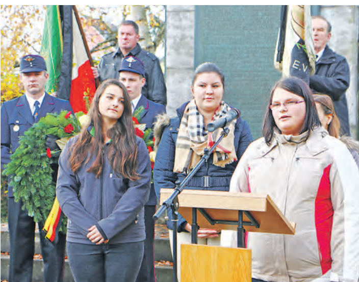
Schülerinnen der neunten Klasse der Böhringer Schule trugen anlässlich des Volkstrauertages Hermann Hesses Gedicht »Dem Frieden entgegen« vor.