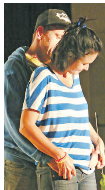
Von den Themen erste Liebe, Sexualität, Verhütung und Teenagerschwangerschaften handelt das Stück »Maria - ein Theater um die Liebe«. Aufgeführt wurde es vom Präventionstheater »Q-rage«.