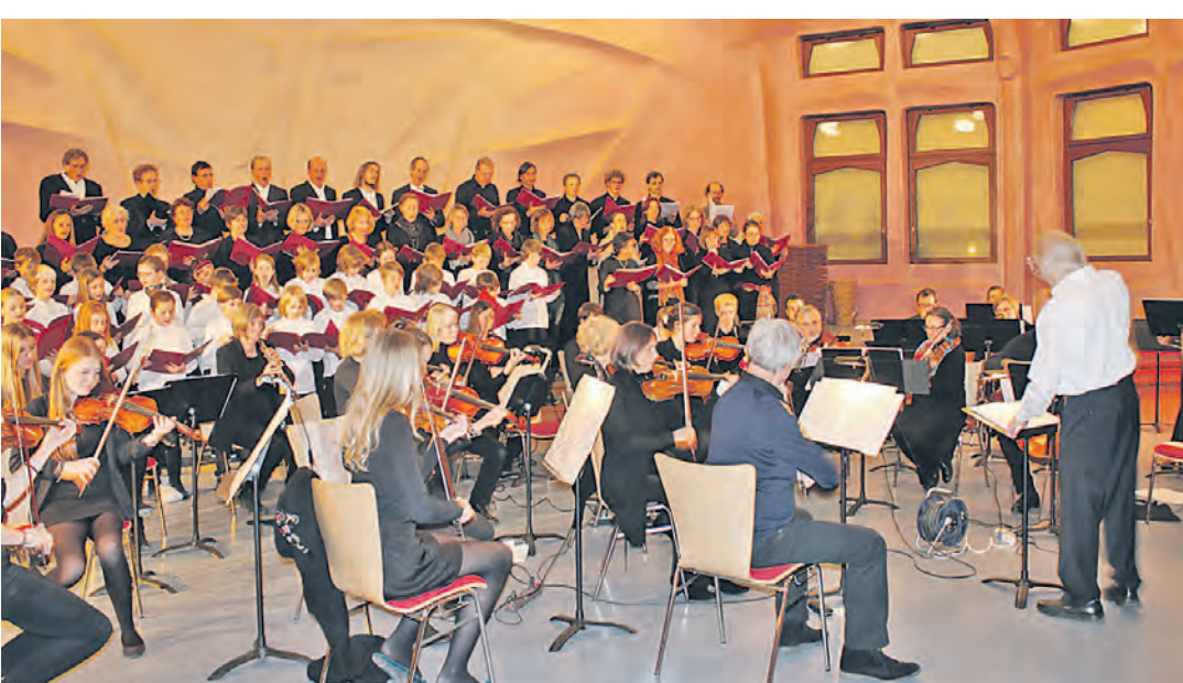
Der Schulchor und das Kammerorchester der freien Waldorfschule Wahlwies konzertieren in der Stockacher Melanchthonkirche.