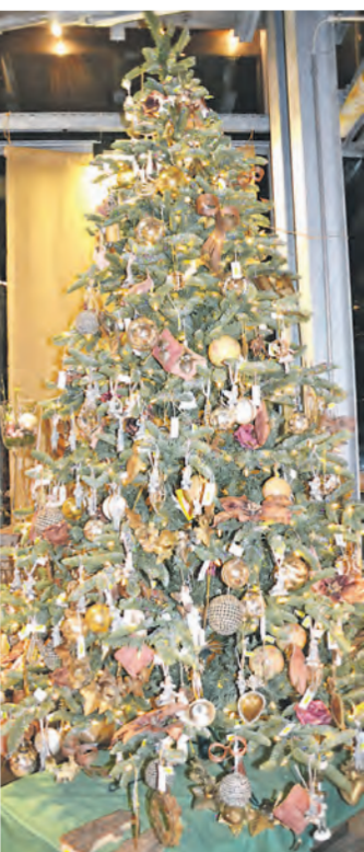
Weihnachten ist für viele eine Herzensangelegenheit.

Was ist Weihnachten? Weihnachten - das ist Tannenduft. Schönes Ambiente. Festliche Stimmung. Hoffnungsvolles Grün gepaart mit funkelnden Lichtern. Wehmut nach Kindheitserinnerungen. Stilvoller Schmuck für Baum und Raum. Weihnachten ist Wassmer. Denn in der »Markthalle« der Familie Wassmer in der Seerheinstraße 6 im Gewerbegebiet »Blumhof« zwischen Stockach und Ludwigshafen gibt es in der Vorweihnachtszeit vieles, was zum Advent und zum schönsten Fest des Jahres gehört. An jedem Tag, auch samstags und sonntags, ist hier von 8 bis 19 Uhr Weihnachtsmarkt. Mit unzähligen Geschenkideen. Mit festlichen Accessoires. Mit Adventsgestecken und Weihnachtsartikeln. Und mit einem wunderschönen Flair, das