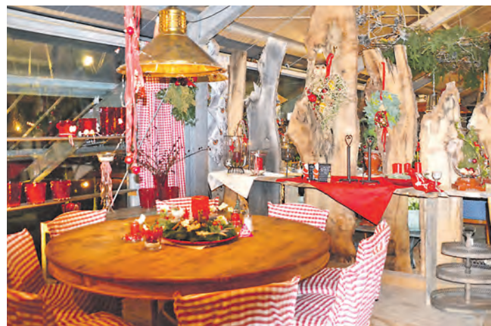
Dieser Schmuck schmückt jeden Raum: Weihnachtliches Flair herrscht in der »Markthalle« in der Adventszeit vor.