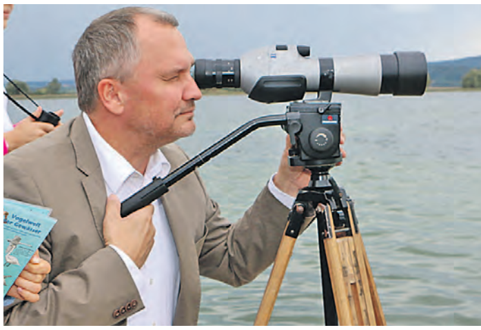
Oberbürgermeister Martin Staab bewies mit seinem Haushaltsentwurf Weitsicht: Mit großer Mehrheit wurde der Haushalt 2015 und die mittelfristige Finanzplanung bis 2018 am gestrigen Dienstag vom Gemeinderat verabschiedet.

Radolfzell (gü). Klare Ziele und deutliche Worte formulierte Oberbürgermeister Martin Staab in seiner Haushaltsrede gegenüber dem Gemeinderat: Sein Schwerpunkt im kommenden Jahr will der Radolfzeller Rathauschef auf den Bereich Bildung und Erziehung legen. »Vorfahrt für Bildung« lautete dabei sein Motto (das WOCHENBLATT berichtete). An dieser Zielsetzung hat auch die Haushaltsberatung nichts verändert. Im Gegenteil: Staab hielt auch am gestrigen Dienstag an seinen Zielen fest. Doch das Dilemma der Haushaltsberatung liegt vielmehr im Detail, wie OB Staab verdeutlichte: »Der Haushalt 2015 ist – so wie eingebracht – genehmigungsfähig. Ab 2016 dürfte es auf der Basis der derzeitigen Finanzplanung schon Probleme geben.« Ab 2018 könne der Haushalt allerdings definitiv nicht mehr genehmigt werden. Vielmehr müsse der Rat dann darauf achten, dass er handlungsfähig bleibt. Um für eine Verbesserung der