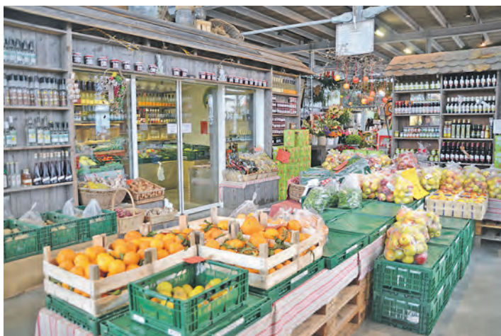
Weihnachten ist nicht nur die Zeit der Plätzchen: Auch gesundes Obst mundet in der schönsten Zeit des Jahres ganz besonders.