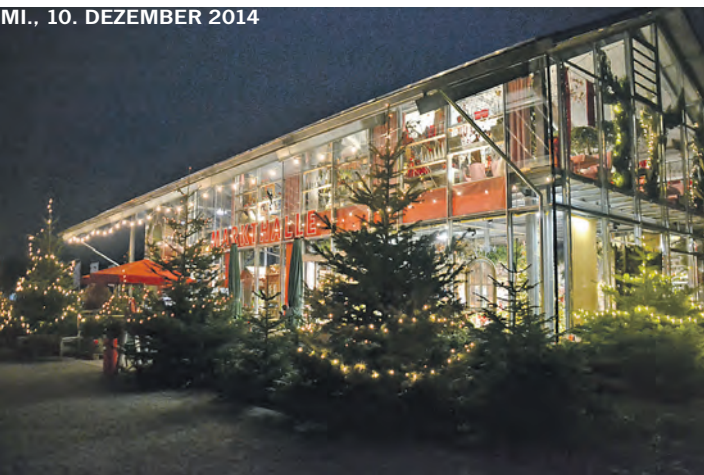
Die »Markthalle« im Gewerbegebiet »Blumhof« zwischen Stockach und Ludwigshafen strahlt zu Weihnachten ein besonderes Flair aus.