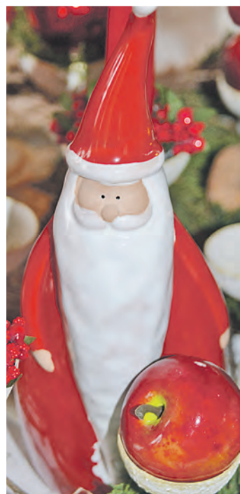
Er ist der unverzichtbare Helfer des Christkinds - der Weihnachtsmann mit seinem langen Rauschbart.

geschmackvoll gestaltetes, stilischer komponiertes Dekor aus weihnachtlichen Kostbarkeiten. Glaskugeln. Kerzen. Kunstvoll kreierte Schilder mit Sinnsprüchen wie »Freunde sind Gärten, in denen man sich erholen kann«. Freundliche Nikoläuse. Oder friedvolle Engel. Und bei der Auswahl oder Fragen hilft das kompetente Fachpersonal gerne weiter. Die beiden Floristikmeisterinnen und das bewährte Team aus freundlichen, hilfsbereiten Damen binden auch Gestecke, Adventskränze oder Blumensträuße ganz nach den Wünschen der Besucher. Nicht nur zu Weihnachten. Das ganze Jahr über. Für alle Anlässe. Doch ganz besonders gerne zu Weihnachten. Und wer sich im Weihnachtsparadies der »Markthalle« von A. Wassmer noch länger aufhalten möchte, der kann im Café Kuchen, Torten und Kaffee genießen. Was ist Weihnachten? Weihnachten ist Wassmer. Denn vieles, was dieses schönste aller Feste ausmacht, gibt es in der »Markthalle« im Gewerbegebiet »Blumhof« gegenüber des Autohauses Auer zwischen Stockach und Ludwigshafen.