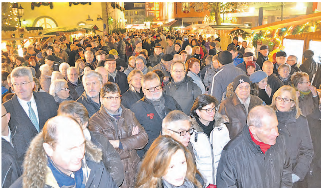
Der Radolfzeller Christkindlemarkt erwies sich bereits am Eröffnungstag als Publikumsmagnet: Am Donnerstag zur offiziellen Eröffnung war nahezu kein Durchkommen mehr auf dem Marktplatz.

Radolfzell (gü). Traditionell mit den Turmbläsern wurde auch in diesem Jahr der Christkindlemarkt in Radolfzell eröffnet. Punkt 17 Uhr schmetterten die Bläser am Donnerstag weihnachtliche Klänge aus dem ersten Stock der Sparkasse. Heimelig, liebenswürdig und traditionell, winterlich dekorierte Stände, weihnachtliches Ambiente, Glühweinduft, heißer Apfelpunsch und leckeres Gebäck – der Radolfzeller Christkindlemarkt war wieder einer zum Verweilen, zum Bummeln und Wohlfühlen. Der feine Duft von Maroni, Glühwein und Plätzchen lockte die Besucher auch in diesem Jahr von Donnerstag bis Sonntag in die Radolfzeller Innenstadt. Eine Vielzahl an festlich verpackten Geschenken und traditio-