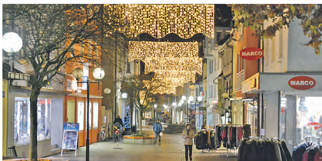
Die neue einheitliche Weihnachtsbeleuchtung in der Radolfzeller Altstadt sorgt offiziell seit vergangener Freitag für Adventsflair. Doch bereits im Vorfeld wurde ob der 70.000 Euro teuren Beleuchtung im Verwaltungsausschuss über die Atmosphäre diskutiert.

Zusätzlich zu den bisher illuminierten Bäumen werden 50 neue Lichtvorhänge mit annähernd 30.000 Lichtpunkten die Altstadt schmücken. Im September hatte der Gemeinderat die Anschaffung der neuen Beleuchtung möglich gemacht, indem er der Erhöhung des städtischen Zuschusses von 14.000 auf 40.000 Euro zugestimmt hatte. Weitere 20.000 Euro stammen von der Aktionsgemeinschaft, und nochmals 10.000 Euro wurden von dem Preisgeld des Stadtmar-