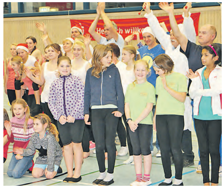
Über 130 Kinder, Jugendliche und Junggebliebene begeisterten bei der Turnschau des TV Radolfzell.

Tabertshofer versprach und einhielt. Seine Absicht ist es, »möglichst viele Jugendliche in Bewegung zu bringen« und am Besten zum »Breitensportverein« TV, der »nicht auf Leistungs- und Spitzensport getrimmt« sei. Und damit hat er Erfolg. Schließlich zählt über die Hälfte der rund 1.100 Aktiven zur Jugend. Turnschauen übrigens finden schon seit über 60 Jahren statt, erinnerte sich »Turnvater« August »Guscht« Dieterle abseits der sonntäglichen Veranstaltung. Gleich zu Beginn machten viele Zuschauer in der vollen Halle mit allen Teilnehmenden beim »Warm-up« der beiden Zumba-Gruppen mit. Die Fußball-WM setzten die »Fun Girls«, das sind Mädchen zwischen 12 und 15 Jahren, sowie zum Abschluss der Veranstaltung jung gebliebene Damen der »Step Aerobic«-Gruppe sportlich um. Dazwischen erfreuten Kinder im Alter von zweieinhalb bis sechs Jahren mit ihrer »Vierjahreszeiten-Aufführung«. Sie erhielten besonderen Applaus für ihre selbst gebastelten Requisiten. Nach gekonnt ausgeführten