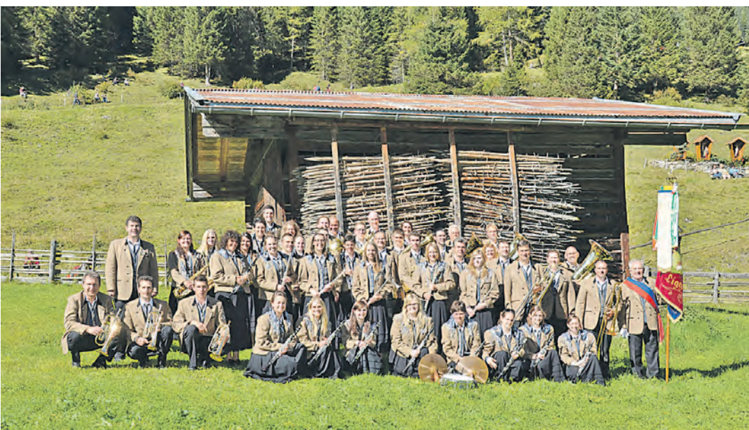
Der Musikverein Liggersdorf sorgt für schwungvolle Unterhaltung mit dem Besten aus zehn erfolgreichen Konzert-Jahren.