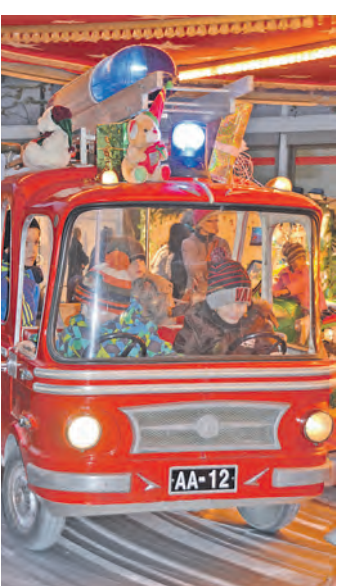
Beim Christkindlemarkt gab es für die großen und kleinen Radolfzeller etwas zu entdecken.