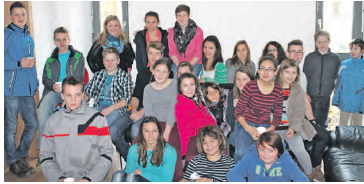
Die Rielasinger Ministranten freuten sich über die Wiedereinweihung der Rielasinger Pfarrscheune, denn dort haben sie ihr Reich.

Bleibe wieder zurück ist und auch darüber, dass eine Familie eine komplette neuwertige Sofagarnitur gespendet hat, auf der sich die Minis bereits bei der Einweihung sichtlich wohl gefühlt haben. Die Pfarrscheune musste nach einem Brand wieder neu aufgebaut werden.