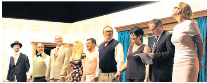
Viel Applaus gab es für das Ensemble des Volkertshausener Weihnachtstheater.