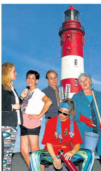
Vom Ende der Behördenruhe auf der Insel Halligström erzählt das Stück »Camping, Koks und Hollywood« der Kulissenschieber im Kulturpunkt Arlen.

Um was geht's? Nordsee-Insel Halligström – dort ist die Welt – noch – in Ordnung. Die drei Angestellten der einzigen Behörde sind mit sich und vor allem mit der wenigen Arbeit sehr zufrieden. Aber kaum ist der Damm zum Festland eingeweiht, wird die Insel von den verrücktesten Besuchern über-