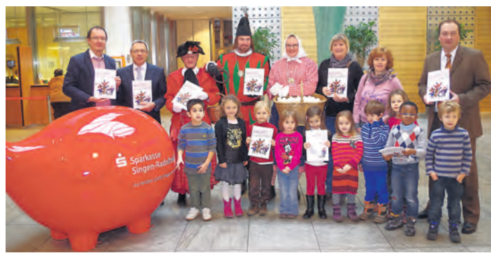
Eine dicke Spende der Sparkasse machte die zweite Auflage der Poppele Kinderfibel möglich. Sie wurde am Montag vorgestellt.

Neben den zum Jahreswechsel angebotenen Führungen durch Kunststudentinnen an den Öffnungstagen, wird am Freitag, 31. Januar, um 21 Uhr, erstmals eine Abendführung angeboten, zu der man sich allerdings unter 077 31 / 92 65 374 oder office@suedwestdeutsche-kunststiftung.de anmelden sollte. Mehr Informationen zum Museum und zur Kunststiftung gibt es auch unter www.museum-art-cars.com