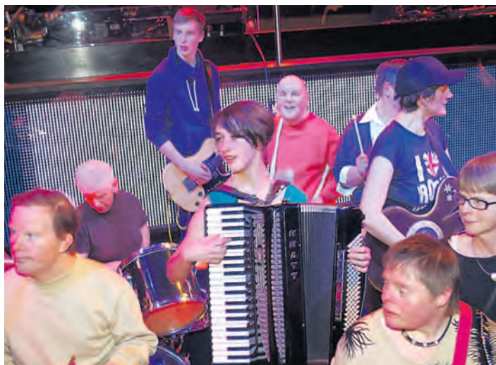
Ihre CD-Premiere konnte Sgt Pirmins Lonely Heart Club Band am Sonntag bei »Come Together – Dance together« im Singener Top10 feiern.