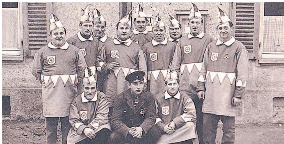
Ein Bild aus den frühen Zeiten der Fastnacht in Hausen. Erst vor 10 Jahren wurde aus der Narretei des Musikvereins und dem »Narrenbaumlochkommando« die »Reblauszunft Hausen«.

Singen (swb). Die Karten für den Seniorennachmittag der Poppele-Zunft am Samstag, 15. Februar, um 14 Uhr in der Stadthalle gibt es seit dem gestrigen Dienstag, 21. Januar, in den Verkaufsstellen der KTS. Am Seniorennachmittag wird das Programm des Poppele-Narrenspiegels in gekürzter Form aufgeführt. Der Kartenverkauf für die Narrenspiegel am Freitag, 14. Februar, und Samstag, 15. Februar, um 20 Uhr hat ebenfalls bereits begonnen. Karten für die Galerie, die sich in erster Linie an Firmen und Betriebe richten, beinhalten zum Preis von 25 Euro den Eintritt, ein Buffet und Freigetränke. Diese Karten sind unter saeckelmeister@poppele-zunft.de zu bestellen.