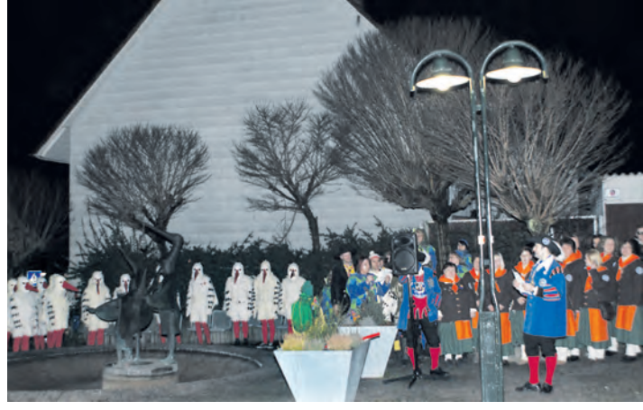
Die Steißlinger Narren eröffneten am Narrenbrunnen die Fasnet 2014.