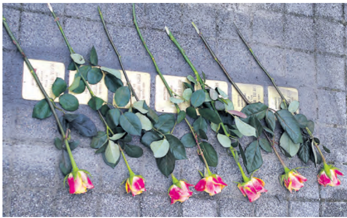
Weitere Stolpersteine sollen folgen: Die Initiative Stolpersteine Singen diskutierte jüngst über mögliche weitere Standorte.