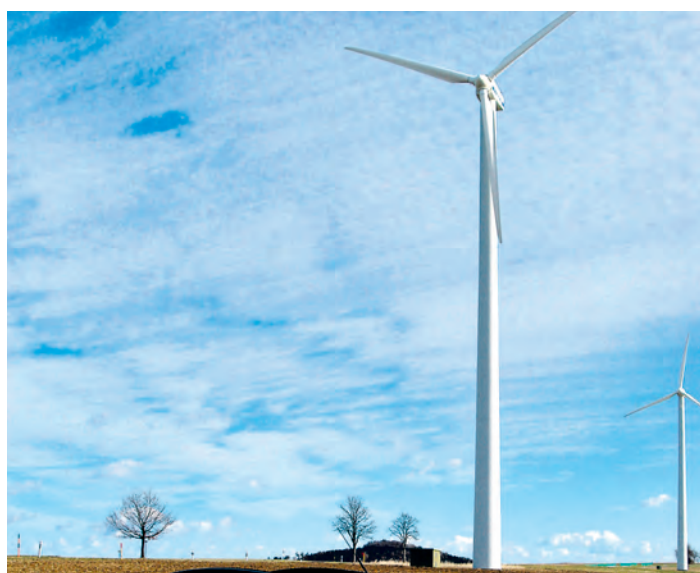
Immer wahrscheinlicher werden die Perspektiven, dass das seit vielen Jahren bestehende Windkraftwerk zwischen Engen-Stetten und Leipferdingen das einzige im Hegau bleibt.

Singen/Hegau (of). Die Chancen, dass es im Rahmen der vom Land gestarteten Initiative zur Energiewende Windkraftwerke innerhalb der Verwaltungsgemeinschaft Singen geben wird, sind nach entsprechenden Untersuchungen auf ein Minimum gesunken. Das ist das Ergebnis der Studien, zu denen sich die Verwaltungsgemeinschaft Singen mit der Region Höri, Radolfzell und weiteren Hegaugemeinden zusammengeschlossen hatte und die durch das Unternehmen »Hage & Hoppenstett« während des ganzen letzten Jahres ausgearbeitet wurden: Für die anfangs genannten über 100 möglichen Flächen wurden so viele Konfliktpotentiale zu Landschaft, Siedlungen wie auch zu Naturschutzgebieten und Vogelpopulationen ausgemacht, dass es letztlich nur für ein Gebiet am Kirmberg bei Steißlingen so etwas wie eine »Restchance« gäbe. Doch auch dort werden zwei Horste des Rot- und des Schwarzmilans vermutet, so dass auch die dort theoretisch