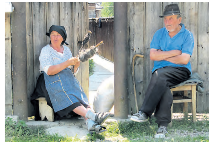
Rumänien entdecken können die Besucher des Vortrags am 6. Februar in Hilzingen.