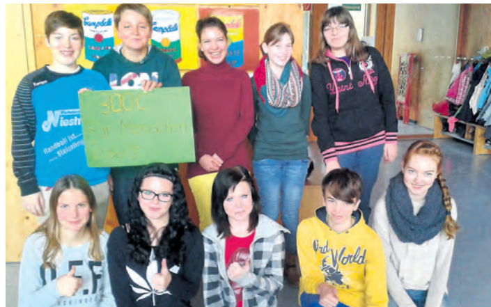
Die Schülerinnen und Schüler der Steißlinger Gemeinschaftsschule halfen der Singener Tafel.