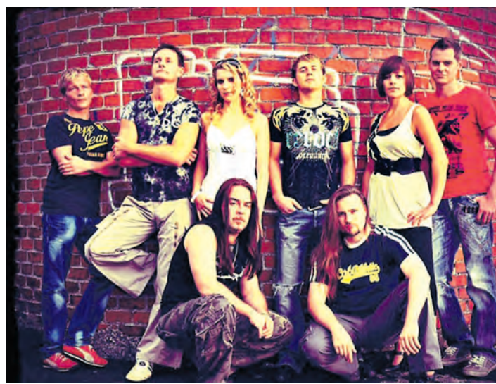
»Crash« heizen beim »Holzhauerball« in Hindelwangen ein.