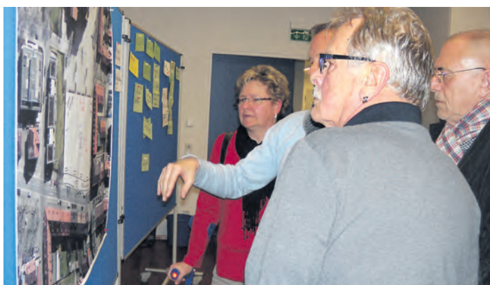
Unterschiedliche Denkanstöße gab es bei der Bürgerwerkstatt zur Neugestaltung des Herz-Jesu-Platzes.

In der lebhaften und kreativen Atmosphäre wurde deutlich, dass es viele spannende, zum Teil kontroverse Ideen zur Platzgestaltung gibt. Es gilt verschiedene Aspekte wie etwa den demographischen Wandel aufgrund der vier umliegenden Häuser mit Seniorenbetreuung zu berücksichtigen. Auch auf die bestehenden Wohnungs-