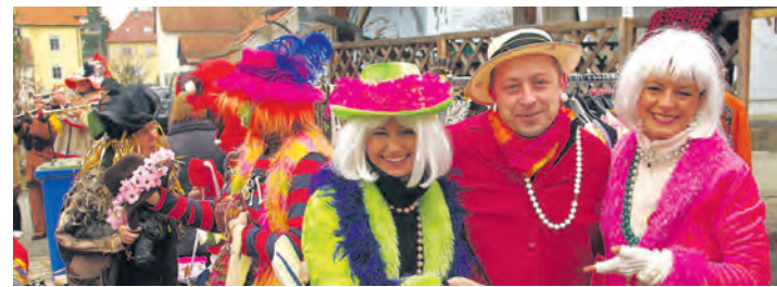
Der Arleiner Flohmarkt der Narrenzunft Katzdorf am Fasnetsamtag wartet mit vielen Attraktionen auf.

Fasnet-Zieschtig, 4.3.: 19 Uhr Trauerumzug mit Böögverbrennen am Narrenbaum.