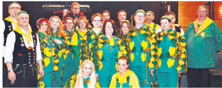
Das Team, das die Hausener Reblauszunft seit ihrer Gründung begleitet hat.