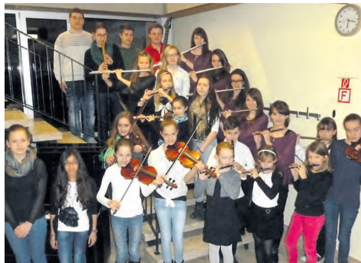
Die Teilnehmer der Jugendmusikschule Westlicher Hegau waren auch in diesem Jahr bei »Jugend musiziert« höchst erfolgreich.