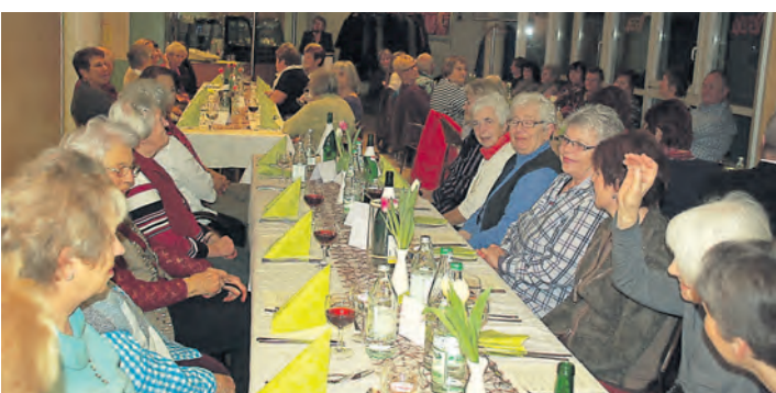
Die große Gemeinschaft von Ehrenamtlichen im Pflegezentrum St. Verena wurde mit einem gemeinsamen Abend gewürdigt.